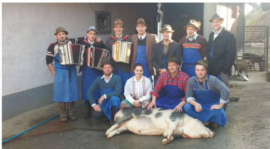
Družba veselih mesarjev