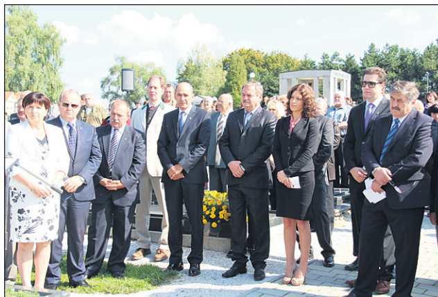
Spominske svečanosti na pokopališču v Ormožu sta se med drugimi udeležila predsednica NSI Ljudmila Novak in predsednik SDS Janez Janša.