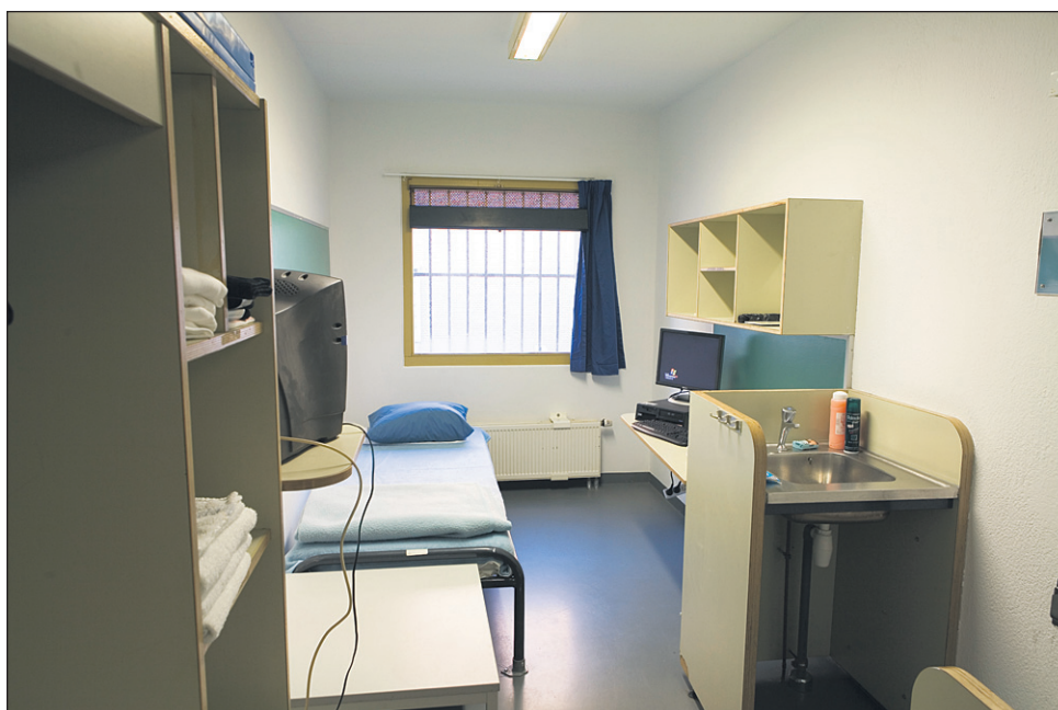
V zaporu na Dobu, kjer so pred dvema letoma odprli dva sodobno opremljena bloka (ki sta državljane stala 12 milijonov evrov), so zapornikom na voljo tudi enoposteljne sobe z lastno kopalnico, fitness, igrišče, sprehajališče in še kaj (fotografija je simbolična).

Trenutno je v Upravi za izvrševanje kazenskih sankcij zaposlenih 851 javnih uslužbencev. Konec lanskega leta je bilo zaposlenih 866 uslužbencev, od tega 542 pravosodnih policistov, 52 pedagogov, 8 psihologov, 11 socialnih delavcev, šest drugih strokovnih delavcev v vzgojnih službah, 79 inštruktorjev in drugih delavcev. Za njihove plače je v letošnjem proračunu namenjenih 21.750.000 evrov. Za devet izplačanih plač v letošnjem letu so porabili že 16.583.667,78 evrov. Povprečna bruto mesečna