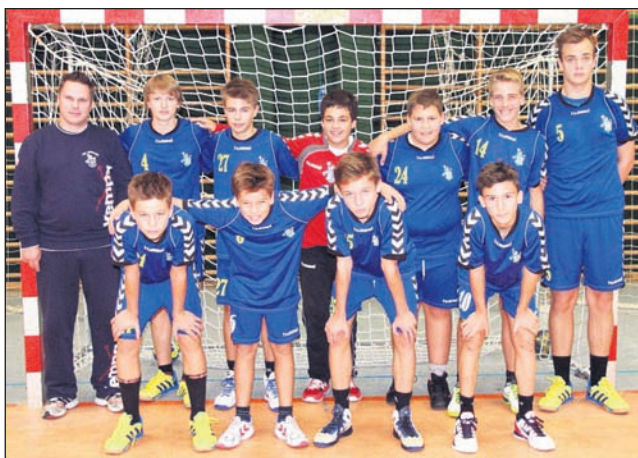
Ekipe starejših dečkov A Jeruzalema Ormoža