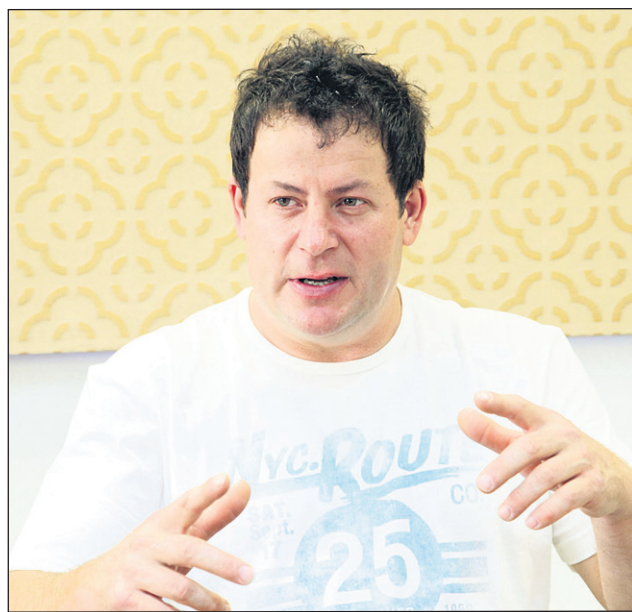
„To so lepi trenutki zame, lahko rečem nepozabni ...“

tudi svetujem in pomagam pri izbiri, da izberejo najboljšo, ter pozitiven in prijazen odnos do vsakega človeka, kupca, ki pride k nam, z vsakim se razumem, vse to so po moje dejavniki, ki so vplivali na to, da so se bralci Štajerskega tednika odločili