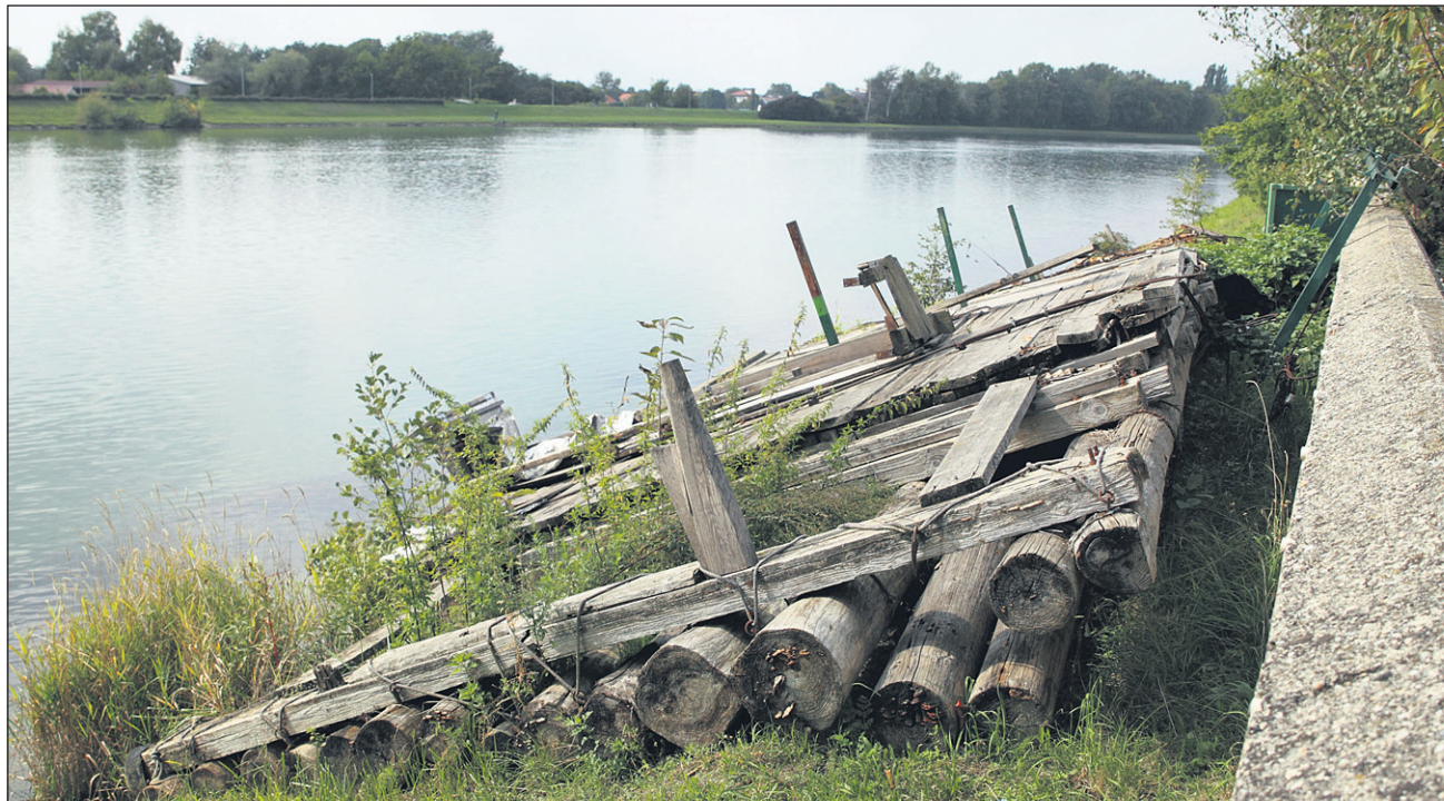
Razpadajoči splav bi bilo treba čim prej odstraniti.