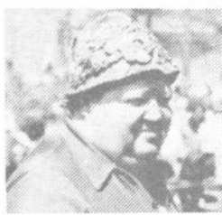
»Nič nimamo proti, če kanec vsega tega veselja ostane tudi za ostale dni.« je sredi najživahnjega tabornega vrveža porekel nek Polhograjec. »Vse te naravne lepote tod okoli so na voljo vsakomur.«

»Blagajana«, čeprav brez večjih izkušenj, je tako vsekakor uspešno prestala svoj test. A tako kot to, prizadevno in vsestransko društvo, bržčas tudi sama turistična ponudba v kraju, ki se vedno pluje v širokem toku neizkoriščenih možnosti.