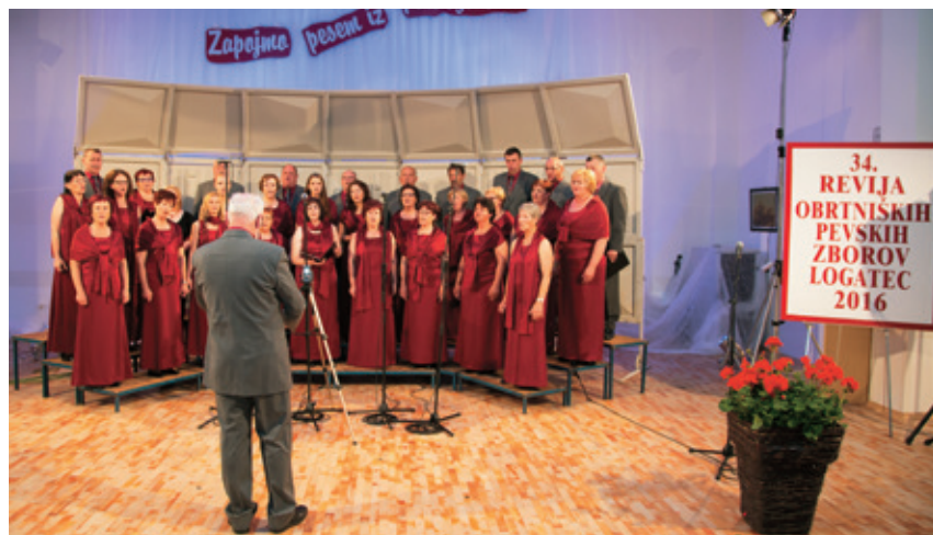
OMePZ »Notranjska« je gostila 34. revijo obrtniških pevskih zborov Slovenije.

Zapis o dogodku je malce obsežnejši, da bi dosegel več bralcev iz obrtniških vrst, kot jih je bilo med poslušalci v dvorani.