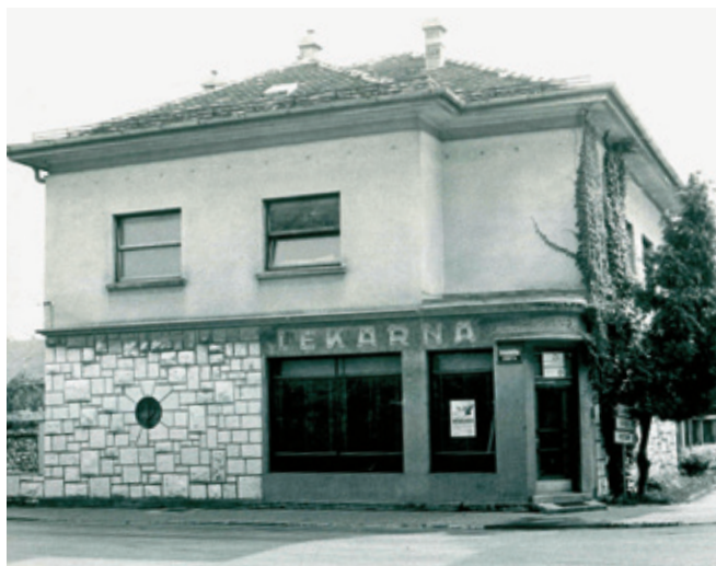
Nekdaj lekarnarjeva vila je po letu 1984 postala dom logaških obrtnikov.

Članice in člani zbornice, to je vaš praznik! Vljudno vabljeni na dogodka Tedna obrti in podjetništva ob 40-letnici OOO Logatec.