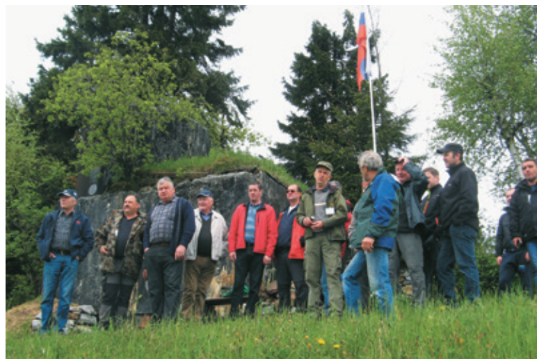
Zaskrbljeni udeleženci pohoda po Rupnikovi liniji

odvodnjava sistem manjših galerij in dvoran (vojašnica z bolnišnico, skladišča, strojnica ...), kjer skozi vse leto potekajo različne prireditve. Pohodniki so si ogledali stalno razstavo ostalin iz časa gradnje. Pohod se je zaključil s piknikom v koči vodiča in se zavlekel v pozne popoldanske ure. Takšne tematske pohode po okoliških krajih bomo organizirali tudi v prihodnje.