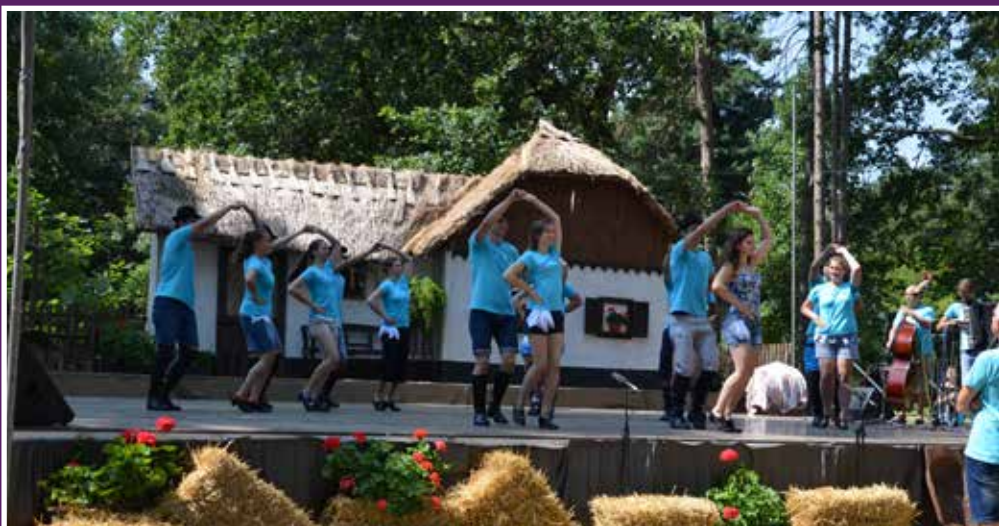
Zadnji popravki na generalki pred nastopom