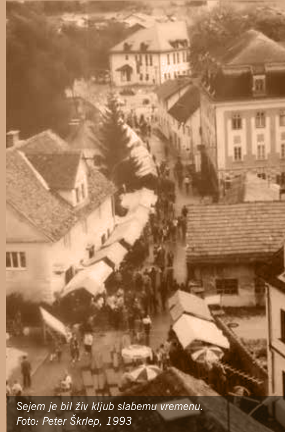
Sejem je bil živ kljub slabemu vremenu. Foto: Peter Škrlep, 1993

Mihaelov sejem je hitro prerasel svoje okvire, zato smo leta 1995 ustanovili