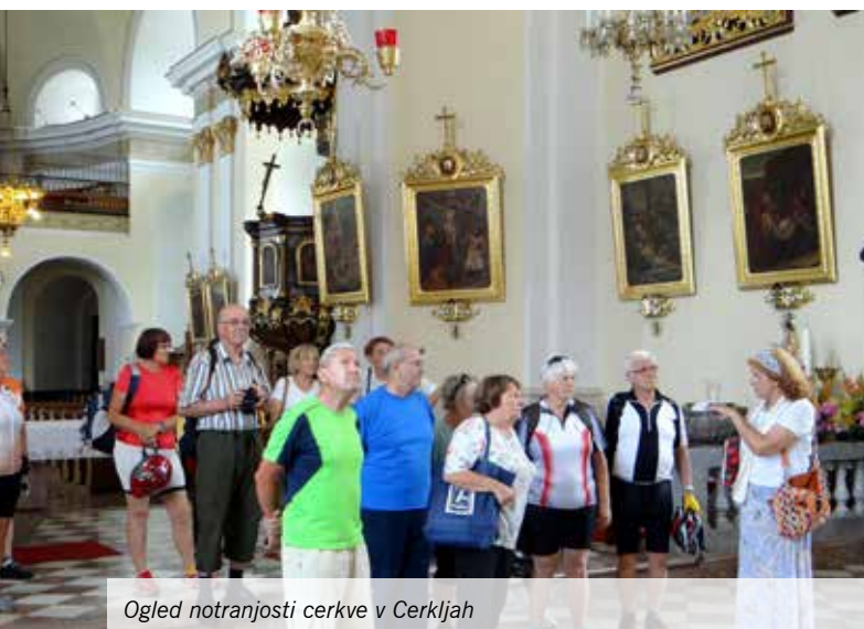
Ogled notranjosti cerkve v Cerkljah

V organizaciji Turističnega društva Mengeš smo se 15. julija 2017 udeleženci kolesarjenja odpravili v Cerklje na Gorenjskem, kjer smo si pod strokovnim vodstvom lokalne vodičke najprej ogledali cerkev Marije vnebovzete, ki je bila zgrajena leta 1777, in njeno okolico s pokopališčem.