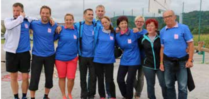
Zmagovalna ekipa Umetniki iz Kulturnega društva Antona Lobode Loka