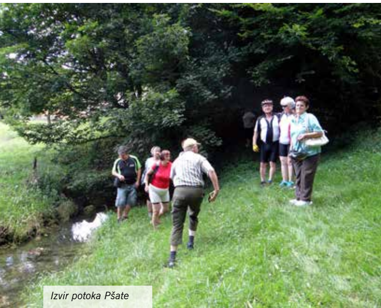
Izvir potoka Pšate