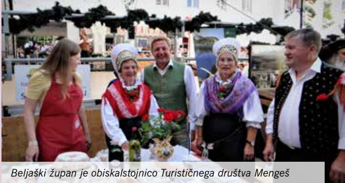
Beljaški župan je obiskalstojnico Turističnega društva Mengeš