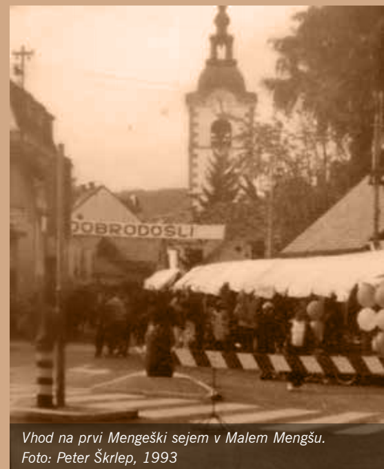
Vhod na prvi Mengeški sejem v Malem Mengšu. Foto: Peter Škrlep, 1993