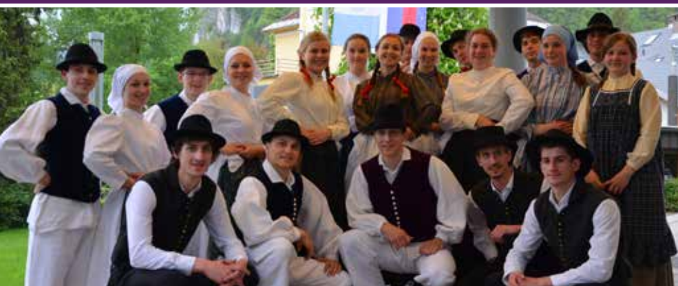
Regijsko srečanje folklornih skupin je potekalo na Bledu 6. maja 2017

S folklorno dejavnostjo se v Sloveniji ukvarja okoli 300 folklornih skupin, v katerih pleše med osem in deset tisoč plesalk in plesalcev. Vse skupine nastopijo najprej na območnih srečanjih, sledi izbor in nastop najboljših na regijskem nivoju, kjer si vstopnico za zaključno državno prireditev pridobijo najboljše skupine,