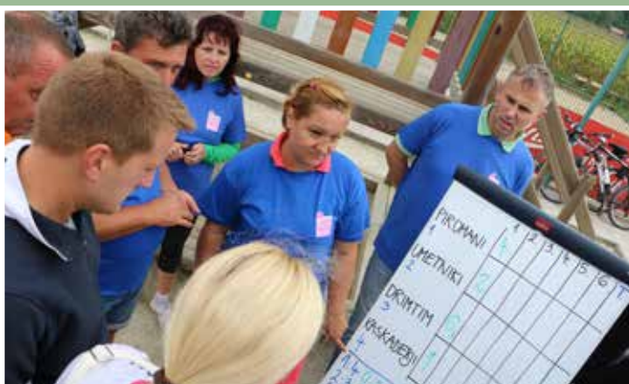
Po vsaki tekmi je bilo potrebno vpisati zmagovalca in dosežene točke