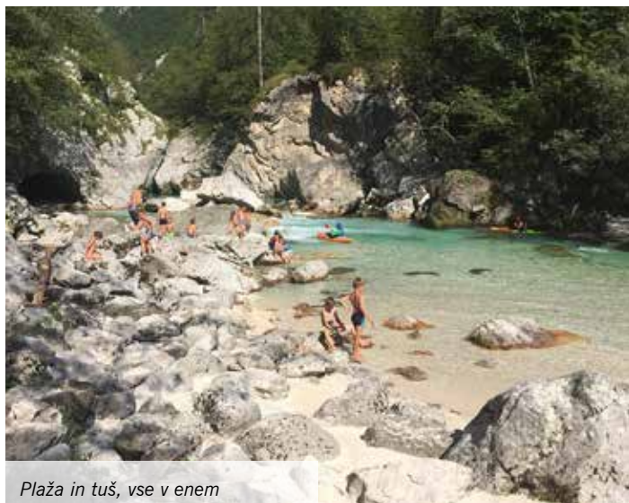
Plaža in tuš, vse v enem

Tabor je vsako leto težko pričakovano - tako s strani otrok kot tudi vodstva. Letos smo po treh letih spremenili lokacijo taborjenja in tako namesto v Bohinju preživeli nepozaben tabor v Kal Koritnici. Rdeča nit letošnjega taborjenja je bilo popotovanje okoli sveta.