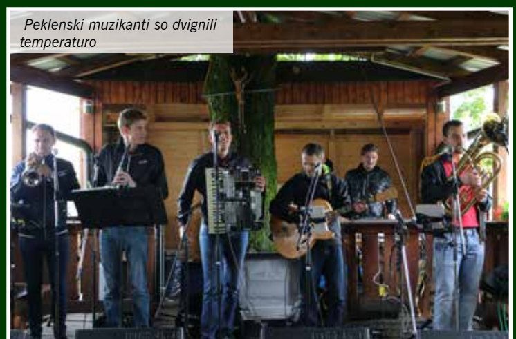
Pekleni muzikanti so dvignili temperaturo