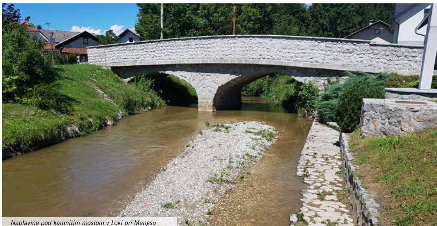
Naplavine pod kamnitem mostom v Loki pri Mengšu