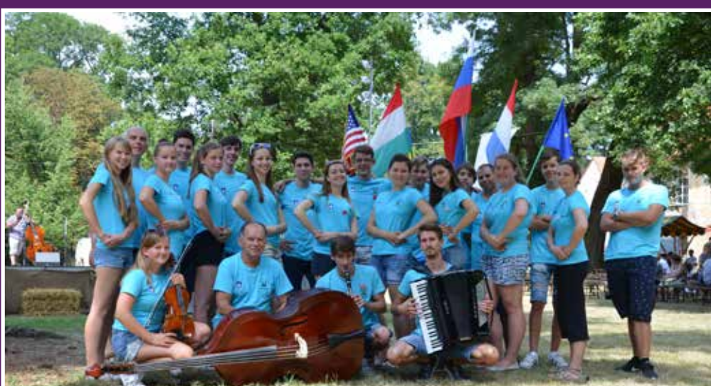
Srečanje v Beltincih je potekalo v lepem vremenu in veselem razpoloženju

kamor v letošnjem letu sodi tudi naša mladinska sekcija.