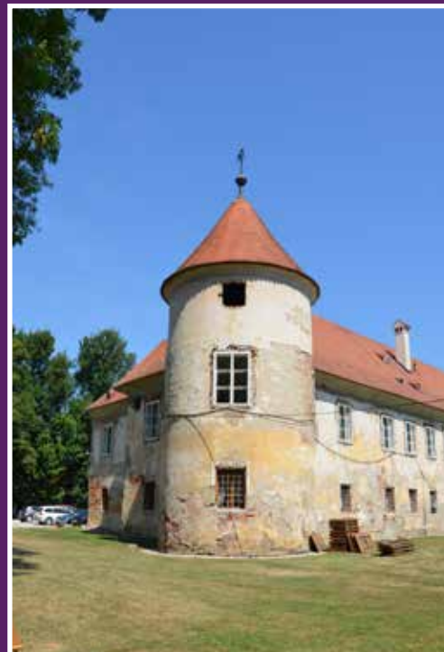
Grad v Beltincih, ki v svojem parku vsako leto gosti najboljše folklorne skupine v Sloveniji