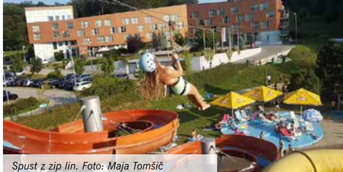
Spust z zip lin.