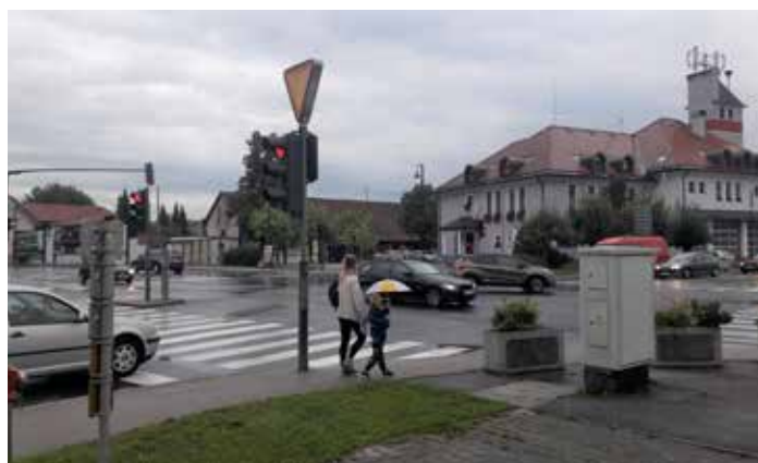
Organizirana je bila dodatna varnost na štirih križiščih oziroma prehodih