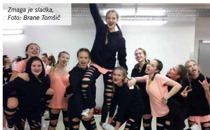
Zmaga je sladka