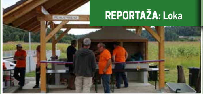
Pujsov vikend se je odlično obnesel tako kot žar in prostor za druženje