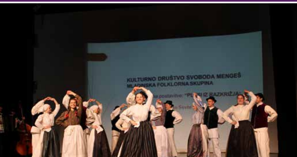
Mladinska folklorna skupina se najprej predstavi na Območnem srečanju folklornih skupin v Kamniku 10. marca 2017

Mladinska folklorna skupina Mengeš je nastopila na državni reviji odraslih folklornih skupin, ki se je tradicionalno odvijala v Beltincih v nedeljo, 23. julija 2017.