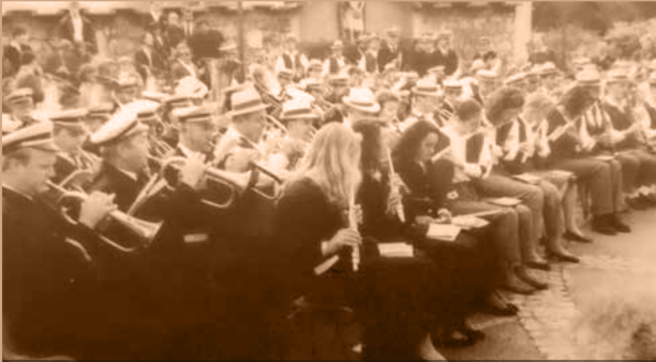
Nastop treh godb na slovesni sveti maši v času Mihaelovega sejma. Foto: Peter Škrlep, 1993

igrali različni glasbeniki s poudarkom na harmoniki, ker je bilo v kraju veliko izdelovalcev harmonik in tudi vsem znana tovarna glasbil Melodija. Mengeške izdelovalce glasbenih instrumentov smo spodbujali, da so sami predlagali vsak svoje izvajalce glasbenega programa.