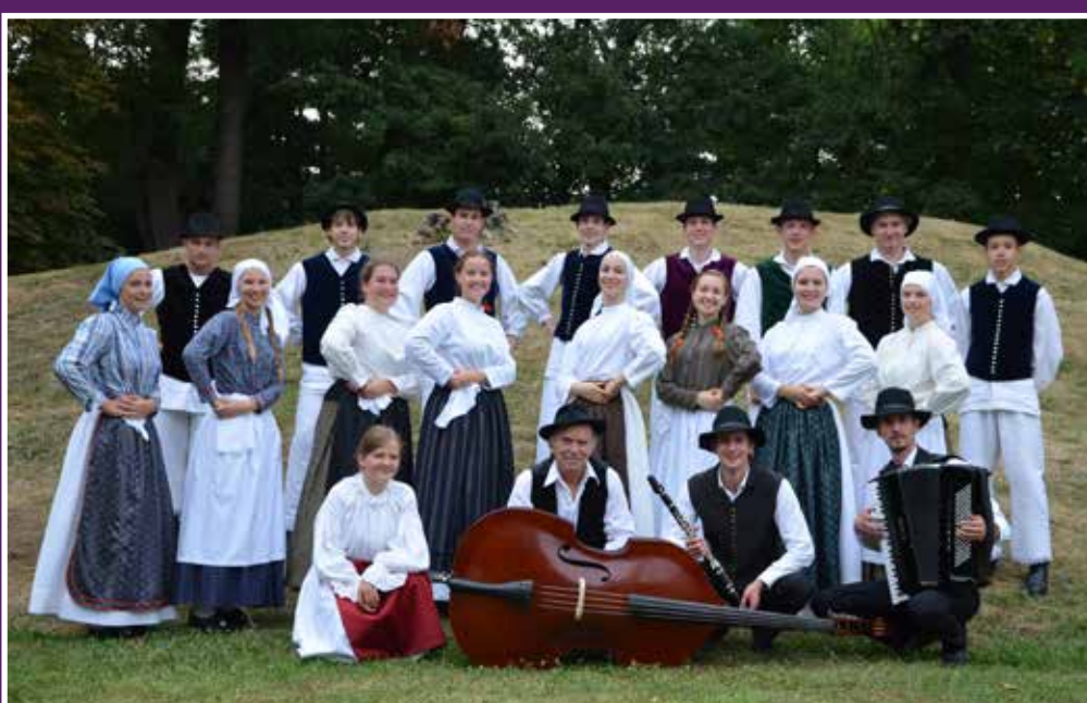
Mladinska folklorna skupina na državnem srečanju v Beltincih