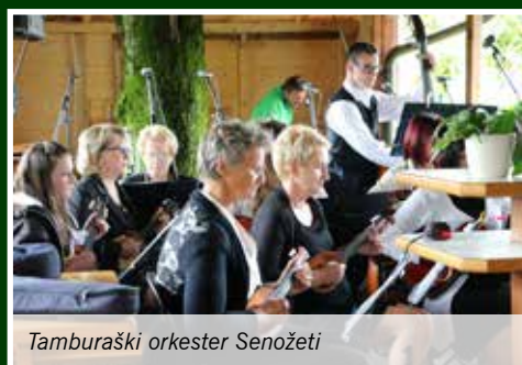
Tamburaški orkester Senožeti