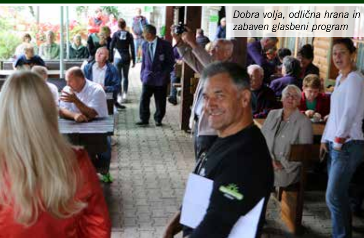
Dobra volja, odlična hrana in zabaven glasbeni program