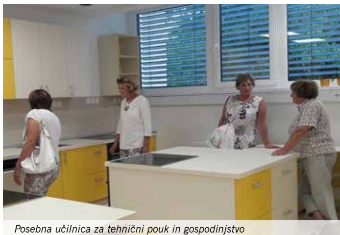
Posebna učilnica za tehnični pouk in gospodinjstvo