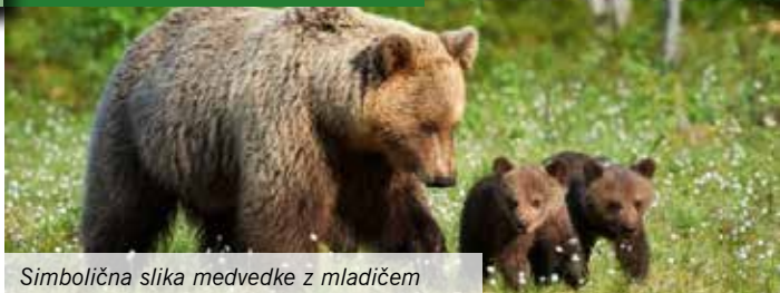
Simbolična slika medvedke z mladičem