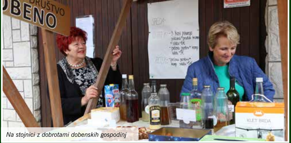
Na stojnici z dobrotami dobenskih gospodinj