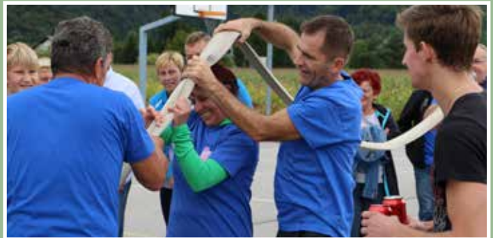
Ena najbolj zahtevnih iger je bilo spuščanje žogice skozi gasilsko cev