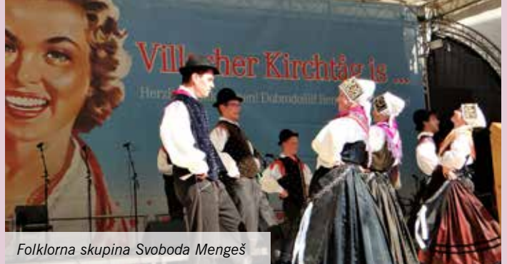
Folklorna skupina Svoboda Mengeš