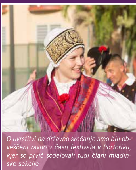
O uvrstitvi na državno srečanje smo bili obveščeni ravno v času festivala v Portoriku, kjer so prvič sodelovali tudi člani mladinske sekcije