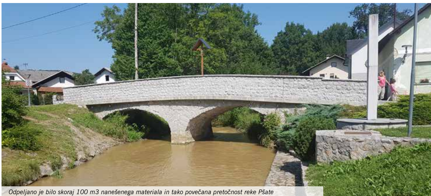
Odpeljano je bilo skoraj 100 m 3 nanešenega materiala in tako povečana pretočnost reke Pšate