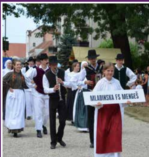
Program se začne s povorko vseh sodelujočih skupin po ulicah Beltincev