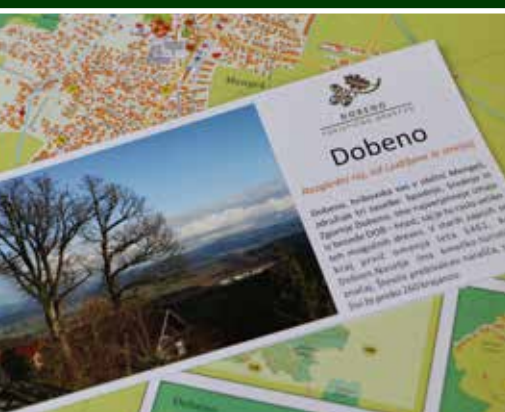
Lepo oblikovana promocijska zloženka Dobena