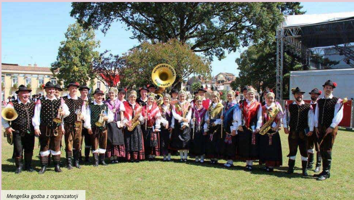
Mengeška godba z organizatorji

Po nekajletnem premoru smo se mengeški godbeniki v avgustu znova odpravili na večdnevno gostovanje v tujino. Tokratna destinacija je bilo mesto Dax v Franciji.