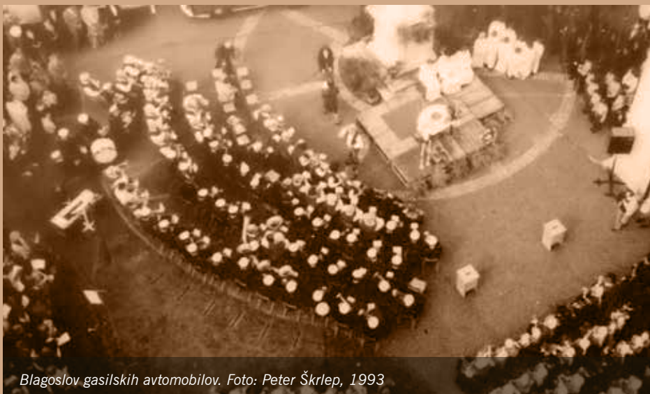
Blagoslov gasilskih avtomobilov. Foto: Peter Škrlep, 1993