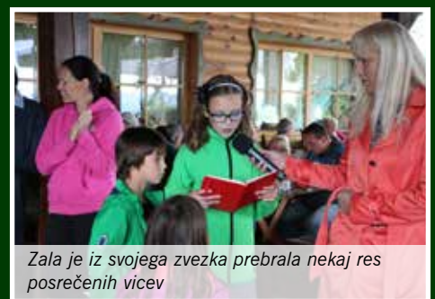
Zala je iz svojega zvezka prebrala nekaj res posrečenih vicev