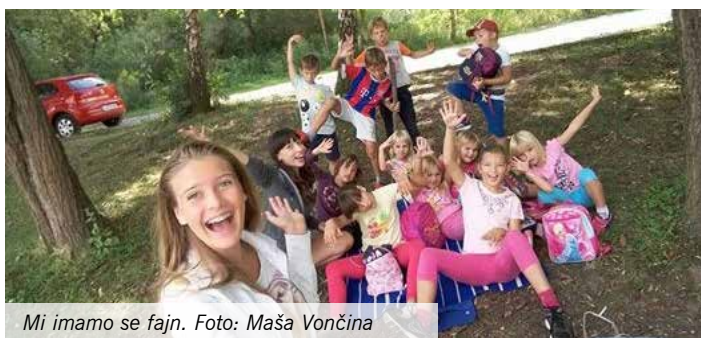
Mi imamo se fajn.