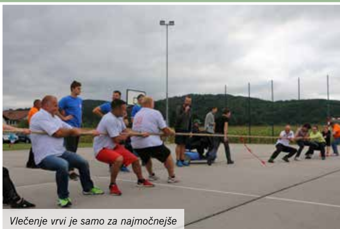
Vlečenje vrvi je samo za najmočnejše

Hoja s hoduljami potrebuje kar nekaj spretnosti in ravnotežja