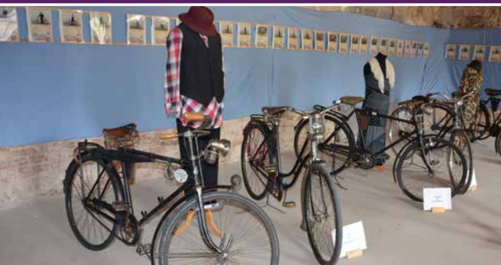
Del programa je bil tudi ogled muzejske zbirke starodobnih koles in oblačilne dediščine