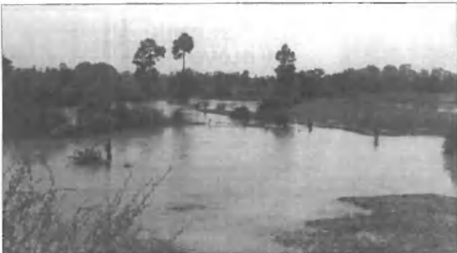
Čeprav je bila v času najinega potovanja (oktober - november) deževna doba že mimo, je bilo vode še vedno na pretek. Na sliki domačini lovijo ribe, ki predstavljajo njihovo običajno hrano.