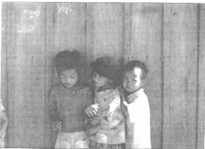
Kamboški otroci na vasi, kjer je revščina zelo občutna

arnih organizacij, ki delujejo v Kambodži, katerim jo je nato tudi izročil v varne roke. Tam so mu povedali, da je to noč že devetnajsti moški po vrsti, ki je pripeljal deklico, namenjeno prostituciji, v njihov urad. Takrat se je odločil, da se bo pridružil Unicefu, prodal svoje prejšnje podjetje v Nemčiji, odšel nazaj v JV Azijo in pomagal pri razbitju mreže otroške prostitucije in prodaji otrok, predvsem deklic, čez meje.