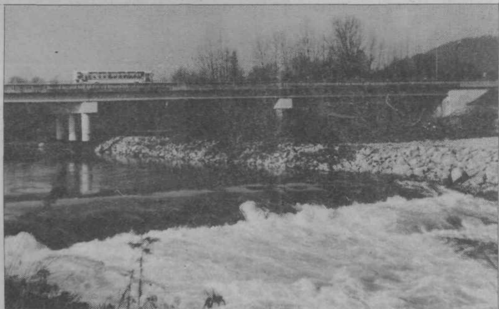
Savski ali šentjakovski most, ki že 15 let služi svojemu namenu, in vodni prag s prelepim prizorom vodne igre. Kmalu bo tu zgrajen še večji most za avtocesto