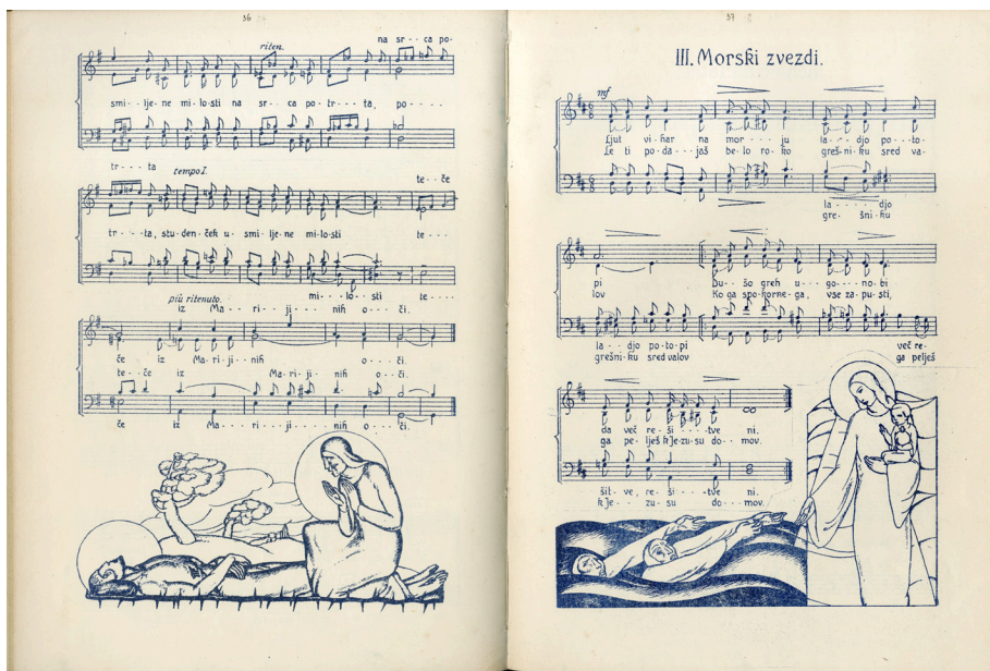
Slika 4: Tone Kralj: ilustracije v zbirki Brede Šček Zvezda Marija , Narodna in univerzitetna knjižnica, Ljubljana.