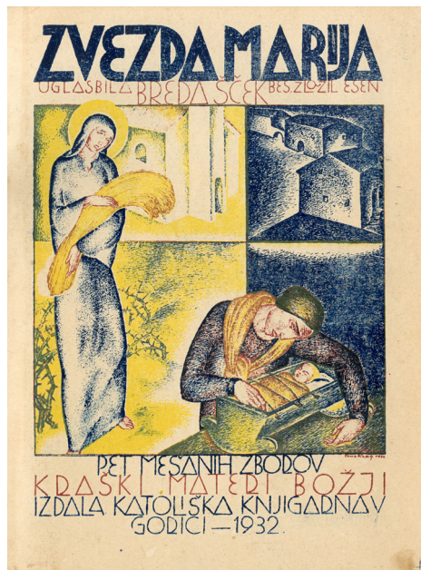
Slika 5: Tone Kralj: ilustracija na platnicah zbirke Brede Šček Zvezda Marija , Narodna in univerzitetna knjižnica, Ljubljana.