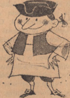
COLONIAL PORK ROLL

Vodeča oblika suho prekajene klobase. Cervelat ima poseben, lahko prekajen okus. Vsebuje v glavnem svinjino, kateri so za posebnost pridejani lorvorjevi listi iz Grčije, posebna španska čebula in orešek iz Indonezije. Poizkusite Burns Cervelat — zares sladokusna posebnost.