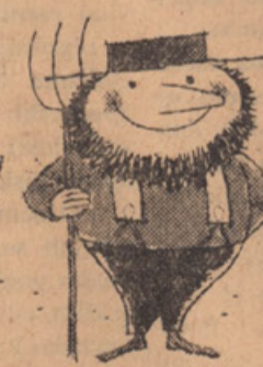
LEBANON BEEF ROLL

Nov, bogat okus vam da Colonial Pork Roll. Recept je izpred 18 stoletja, toda Burnsov način izdelave je najmodernejši na svetu. Pridejane so poznane Herman Mayer dišave, ter posebnost pekočega ali nepekočega okusa.