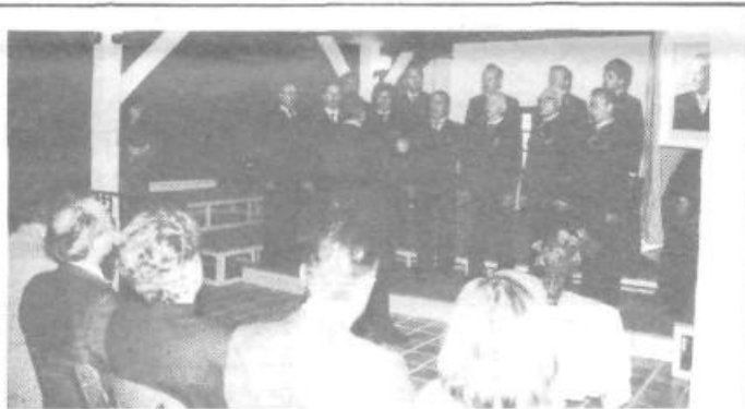
PRED PRAZNIKOM OF V VODNIKOVI DOMAČIJI