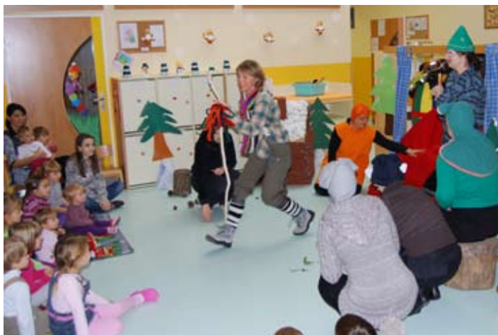
Strokovne delavke smo razveselile z igrico Palček Pohajalček.