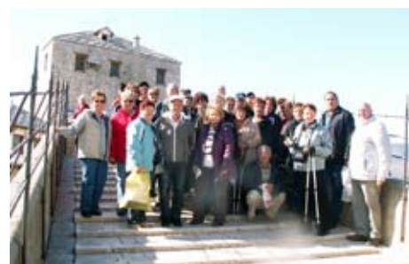
Novi most čez Neretvo je zdržal.

DECEMBER: Kar nekaj tradicije je v teh naših izletih. Izlet v »neznano« je vedno v tem mesecu. Letos smo za spremembo šli v Celje. Kar nekam malo časa smo planirali za ogled precej nove znamenitosti Celja: »Mesta pod mestom« in njihovega Pokrajinskega muzeja. Bilo je hladno, a na moč zanimivo. Zaključek, kot se spodobi, je potem sledil v gostišču na Črničevu. Prav lepo smo se imeli, le bolj malo nas je bilo. Očitno zima, mraz in še posebej gripa ne spodbujajo druženja ljudi. Morda bo pa drugo leto bolje!