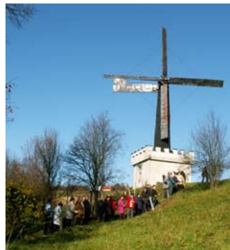
Pred zabavo, »martinovanjem« v Jakobskem dolu, smo si ogledali prav zanimiv in še delujoč mlin na veter.