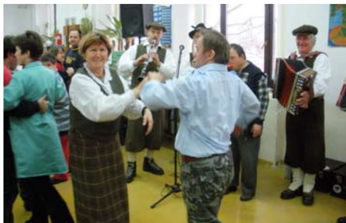
Zavrtili se in zavriskali!

Slovo od starega in prihod novega leta smo v Varstveno-delovnem centru INCE Mengeš proslavili ob zvokih ansambla Suha špaga iz Škofje Loke. Ta nadvse zanimiv ansambel sestavljajo ljudski godci (pevci), ki igrajo na harmoniko, klarinet in kontrabas, poleg tega pa še na instrumente, ki jih ne vidimo oz. slišimo prav pogosto, kot na primer piščal (kazu), »ribežen« in »škafbas«. Člani ansambla so ustvarili imenitno vzdušje, dokaz temu pa je bilo prepolno plesišče. Zanimivo je, da je bil ansambel ustanovljen z namenom, da popestri dogajanje na smučarskih tekmovanjih s starinsko opremo, člani