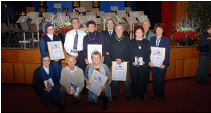
Skupinska slika nagrajencev TD Mengeš