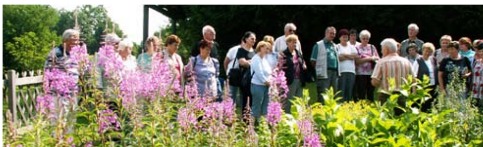
Ing. Majes nam je o zdravilnih rožicah povedal marsikaj zanimivega.