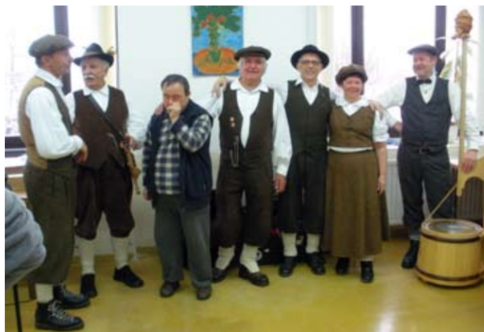
Ansambel Suha špaga