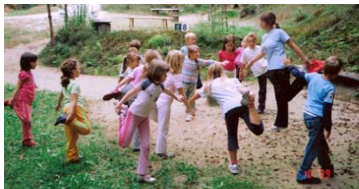
Vaje za raztezanje na poligonu Gibanova

Srce me povezuje – stičišče NVO Srca Slovenije