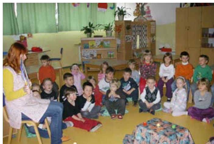
Poslušanje pravljice ob svečkah