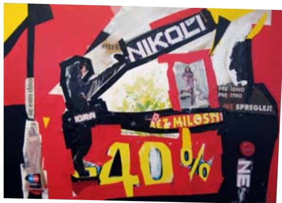
Izbrana dela naših članov na razstavi Kolaž