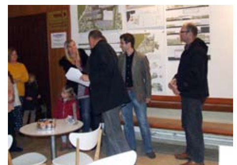
Avtorji zmagovalne rešitve