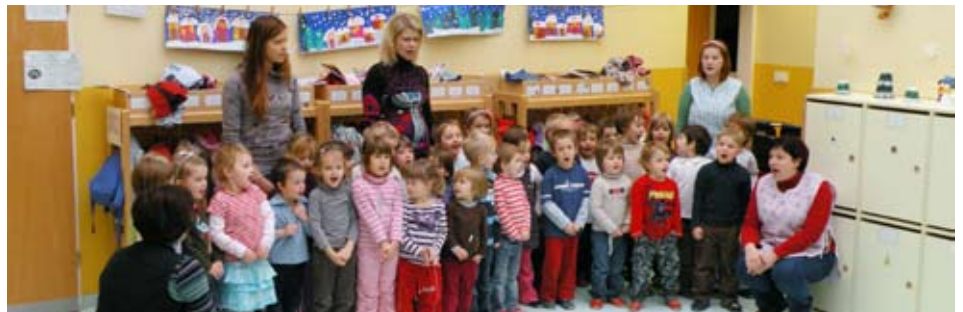
Otroci pojejo v pozdrav.