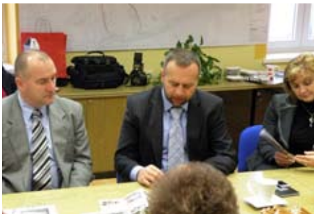
Sprejem na občini