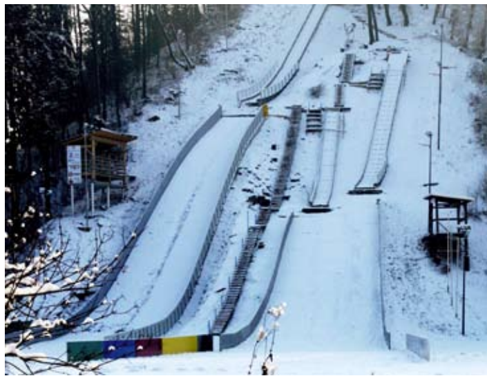
Skakalnice čakajo na snežno odejo.