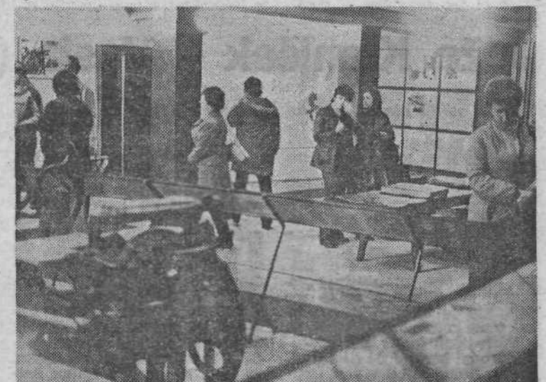
Direktor muzeja v Drvarju Bosnić, ki je kot skojevec sodeloval v bitki za Drvar ob nemškem desantu, je zbranim nazorno opisal potek bojev, v katerih je partizanska vojska zabeležila še eno pomembno zmago nad sovražnikom.