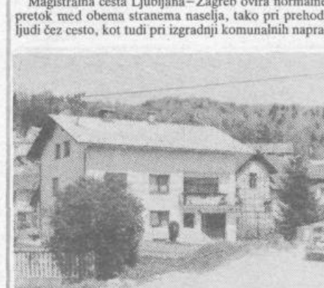
Škofljica postaja nekakšno »bivalno naselje« Ljubljane