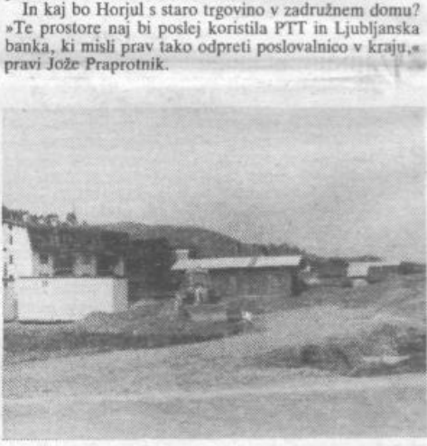
Za horjulsko trgovino