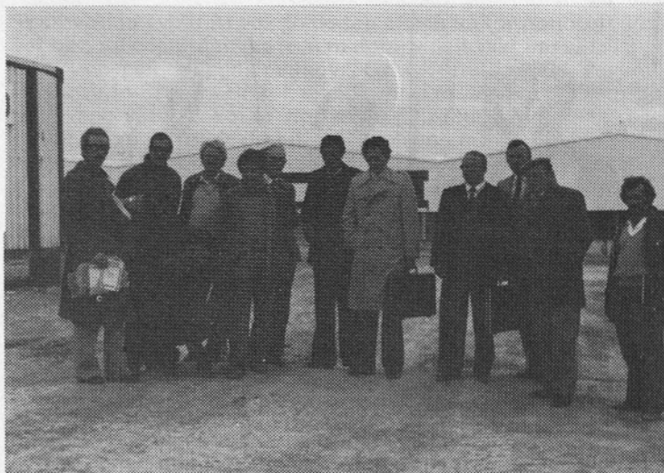
Pred novo tovarno čevljev v Frenidi.

V čevljarski industriji zanimanje za proizvode iz poliuretana upada. Potrebe nihajo: enkrat več, enkrat manj, vse kaže pa da je PU za čevljarsko industrijo v zatonu. Bodoči razvoj je le v tehničnih artiklih. Na tem področju pa smo bili po vsej verjetnosti premalo agresivni, da bi osvojili širša tržišča.