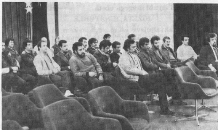
Po šestmesečnem usposabljanju so se v Alžir vrnili alžirski delavci. Razgovor pred odhodom.