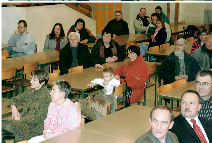
Člani društva in gostje na predstavitvi Zgodovinskih zapisov št. 4, 19. decembra 2007, v Osnovni šoli Ormož.