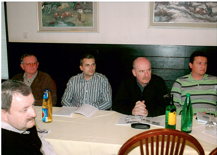
Predstavitve Zgodovinskih zapisov 16. aprila 2010.