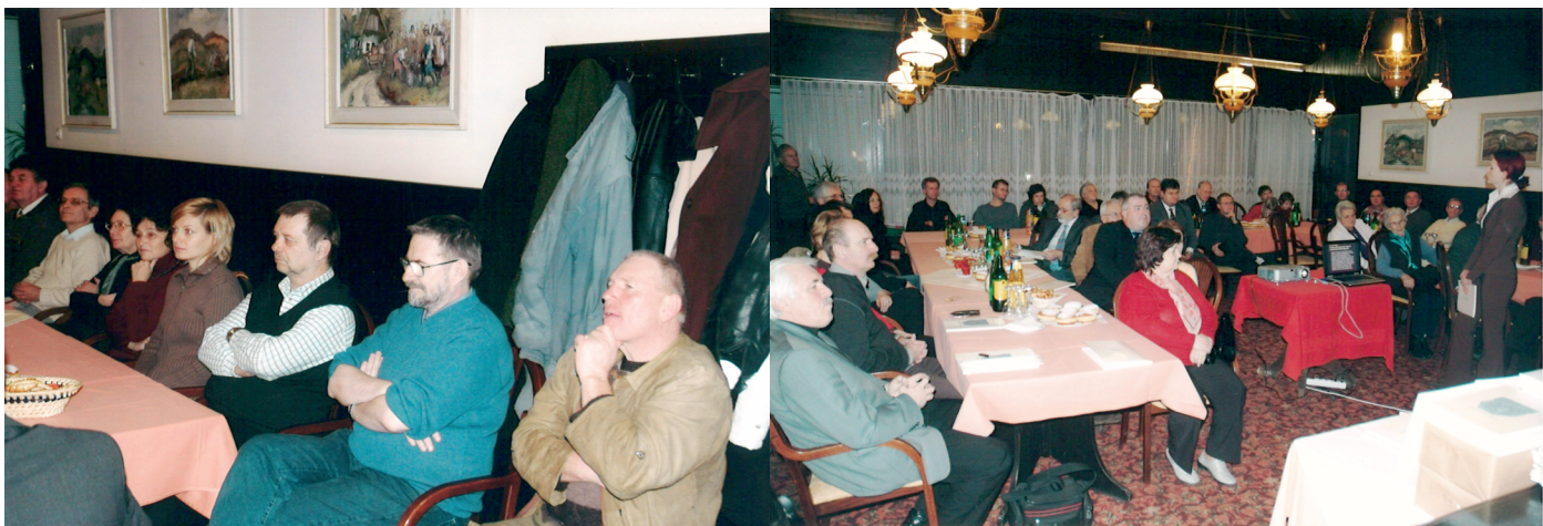
Člani društva in gostje na predstavitvi Zgodovinskih zapisov št. 3. februarja 2007 v Lovski sobi Hotela Ormož.