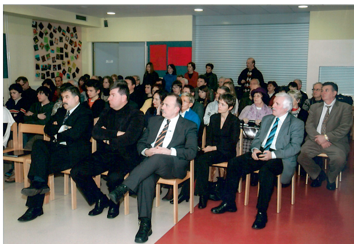
Gostje na predstavitvi Zgodovinskih zapisov.