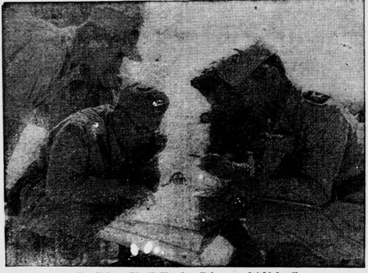
Poveljstvo velike italijanske odlinke na egiptski fronti