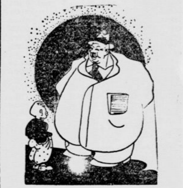
»V katerem razredu si, malček?« »Za sedaj se v razredu peresne teže!«