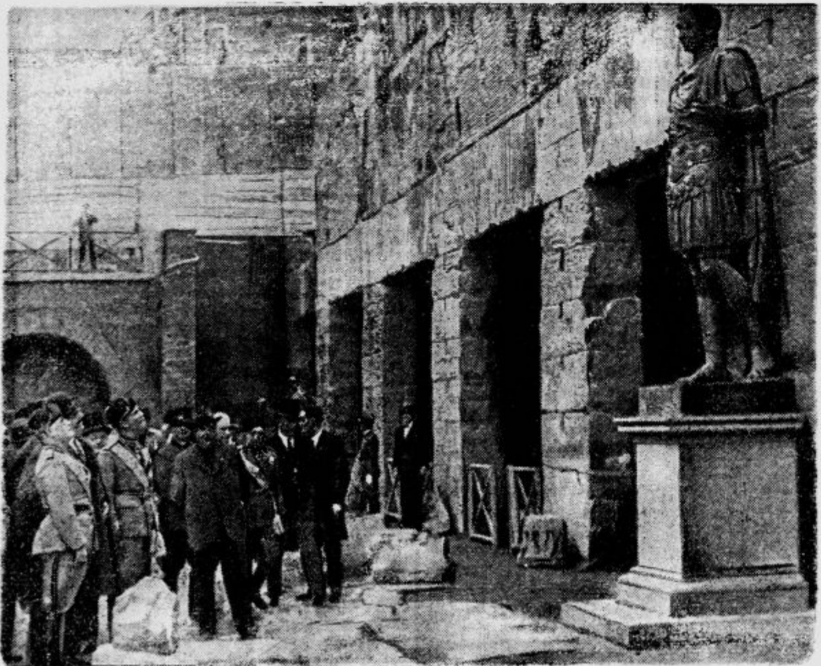
Cesarjev forum v Rimu

»Rad bi kos mila, ki močno diši.« je zahteval Petrečič v drogeriji. »Ali je mama tako rekla?« »Ne, tako hočem jaz. Mama naj opazi, kadar si bom umil obraz, da mi ne bo treba umivanja kakor vedno ponavljati!«