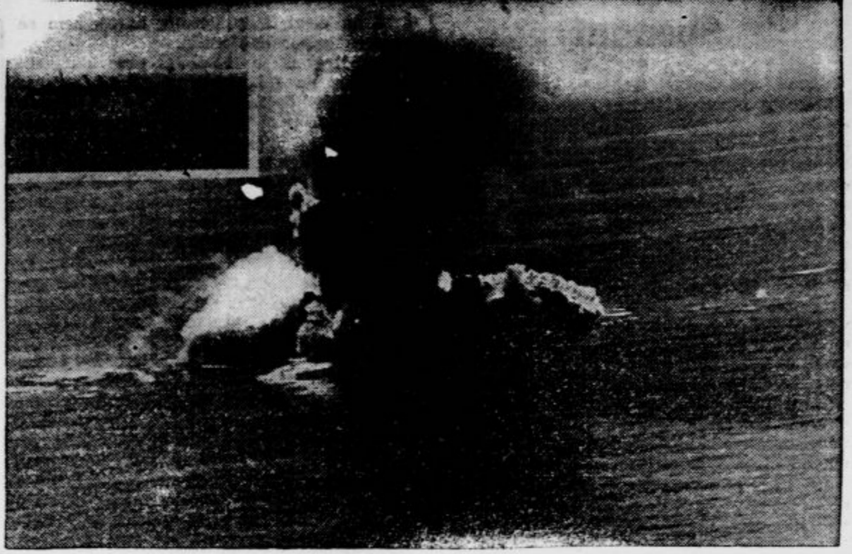
Akclja torpednih letal, ki jo je omenilo vojno poročilo števil. 786: Levo zgoraj parnik med napadom. Eksplozija torpedov, ki so potopili edinico

280. Križanka Vodovarno: 1. Argentina, 7. anali, 8. en, 10. ata, 11. os, 12. rog, 14. vrt, 15. itak, 16. Lear, 17. čaj, 19. oca, 20. ar, 21. Ada, 23. Al, 24. ocena, 25. Albančiča. Navično: 1. Američana, 2. ga, 3. ena, 4. nato, 5. tla, 6. Australia, 9. notar, 11. orača, 13. gaj, 14. veo, 18. eden, 21. Aca, 22. Anč, 24. Ob.