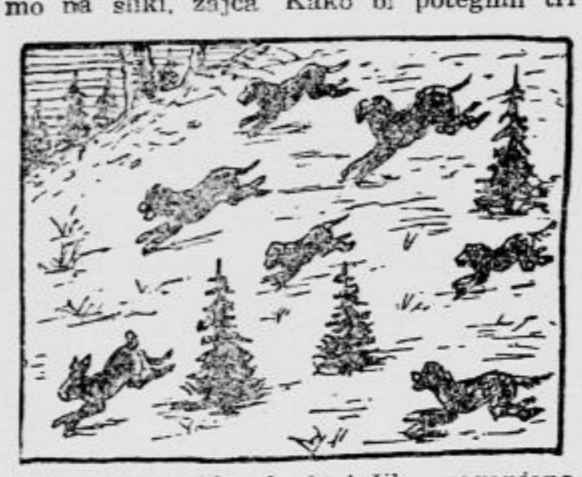
črte čez vso sliko, ki bi ločile preganjano žival od preganjajočih in tudi psa od psa?

295. Za hitre računanje Z uporabo vseh števil od 1 do 9 sestavite račun, ki bo dal kot rezultat 13!