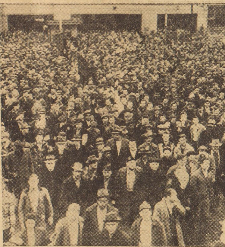
Prizor s stavke avtinskih delavcev CIO pred Chryslerjevo tovarno v Detroitu. Unija avtinskih delavcev zahteva 10c povišanja na uro za vsakega delavca za vzdrževanje penzijskega in blaginjskega sklada.

ber govornik s prikupnim nastopom. Kot član uredniškega štaba je podkovan o raznih vprašanjih. V Clevelandu se je udeleževal pri društvih, kulturnih organizacijah in reviji Cankarjev glasnik, dokler je izhajal. V Chicagu sta imela s Kuheljem predavanje o Jugoslaviji pred več ko 300 ljudmi, zato ni nobenega vzroka, da bi jih ne bilo v mnogo večji clevelandski naselbini najmanj 600. Predavanja take vrste so privlačna in podučna obenem. Z njimi se zbistrijo pojmi in zajame prava slika razmer v Jugoslaviji, katero nam nasprotniki skušajo predstaviti v napačni luči.