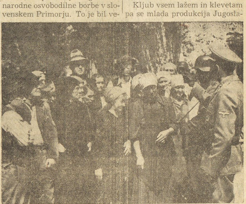
Scena iz filma "Na svoji zemlji"

Po osvoboditvi so napravili veliko število dokumentarnih filmov kot "Ljubljana pozdravlja osvoboditelje", "Masčujmo in kaznujmo" in mnogo drugih, katere so tisoči in tisoči gledalcev navdušeno pozdravili. Iz leta v leto se domača filmska produkcija naglo razvija. Obzorniki in dokumentarni filmi, čedalje boljše tehnične izdelave, in vedno bolj aktualne vsebine, so stalno na programu. L. 1948 so izgotovili prvi umetniški film "Na svoji zemlji", po scenariju slovenskega književnika Cirila Kosmača, ki prikazuje dogodke iz narodne osvobodilne borbe v slovenskem Primorju. To je bil ve-