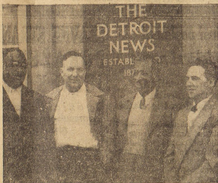
Četvrtica članov unije avtnih delavcev CIO pred poslopijem lista Detroit News, proti kateremu so pred dvema leti vložili tožbo zaradi blatenja in neosnovanih obdelžev, da so bili v zaroti za umoritev Walterja Reutherja, predsednika avtne unije. Lastnik lista je zadevo izravnal izven sodišča s plačitvijo gotove vsote.

tudi tako grozno odjeknilo. "Grozno" za stari red — za profit! In baš zato, ker je v Rusiji le eden kapitalist: država ali, če hočete — Stalin. Ako bi tukaj država lastovala ves profit zadnjih 5 let po vojni, ne bi imela nič dolga, pač pa mnogo denarja na bankah! Amerika bi lahko naredila "raj" in še konkurirala s cenami na svetovnih tržiščih. Z eno besedo: Amerika bi bila največja sila na svetu! Rusija bi ostala daleč zadaj.