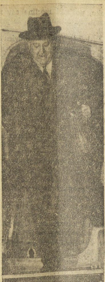
Trygve Lie, generalni tajnik Združenih narodov, po vrnitvi iz Moskve, kjer je konferiral s Stalinom in drugimi sovjetskimi uradniki o možnosti sklicanja konference štirih velesil za „zmanjšanje napetosti“ mrzle vojne.

V Škofljah so uprizarili vidaljevski informbirojevci obrekovalno „zborovanje“, naperjeno proti jugoslovanski coni Svobodnega tržaškega ozemlja. Ljudske množice iz jugoslovanske cone so ob meji obeh con z učinkovitim protestom odgovorile na to smešno izzivanje.