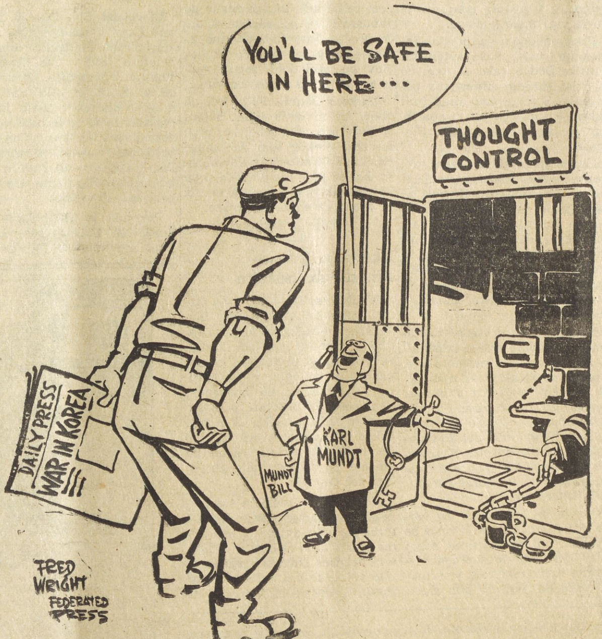
Senator Mundt, republikanski reaktor iz Južne Dakote, ki je s svojim pajdašem kongresnikom Nixonom iz Kalifornije skotil fašistični zakonski osnutek, si znova prizadeva, da bi potisnil delavce v prisilni jopci in jih cesdal z kontrolo mišljenja.

Bolgarska vojaška straža prekoračila mejo