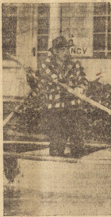
Žrtev povodnji vesla v čolnu v mestecu Eugene, Ore., kjer so silne poplave poglne tisoče ljudi v hribe.

da so jih drugi dan odpeljali v trgovino.