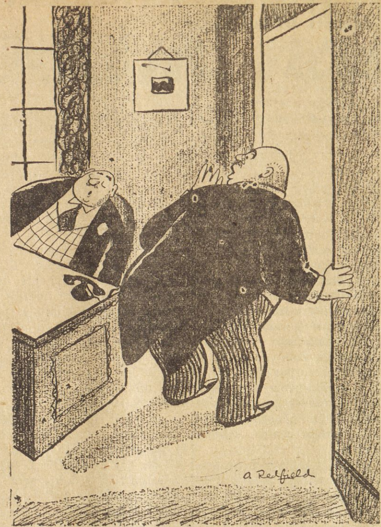
"Zbudi se, ker je čas, da greva domov."

obljub, nebes in pekla ljudi utrudil na smrt, smo pri plebiscitu propadli: 59% glasov za Avstrijo, 41% za Jugoslavijo.