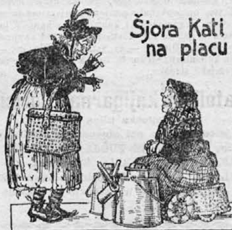
Šjora Kati na placu

Dne 25. avgusta si dal ali dobil: za 100 dinarjev — 47.25 L. za 100 k. kron — 78.75 L. za 100 fr. frankov 124.50 L. za 100 šilingov — 832. — L. za 1 dolar — 26.40 L. za 1 funt — 128.25 L.