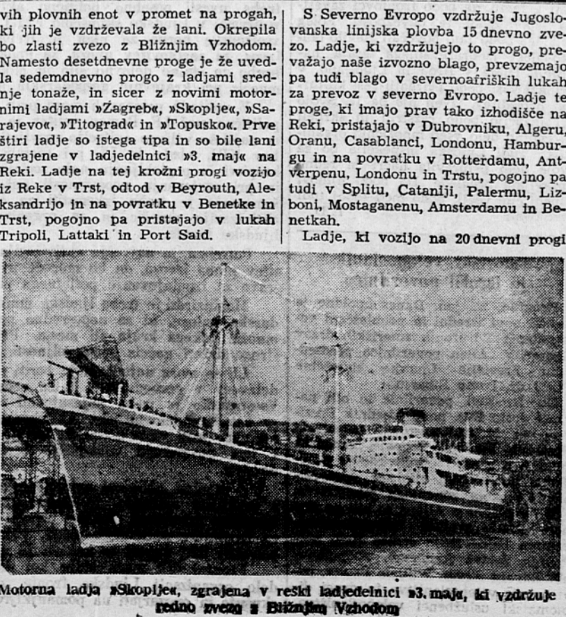
Motorna ladja »Skoplje«, zgrajena v reški ladjedelnici »3. maja«, ki vzdržuje redno zvezo s Bližnjim Vzhodom

Frankfurt, 24. jan. (Tanjug). Ob najnovejšem razvoju dogodkov v zvezi s Posaarjem je objavila Komunistična partija Zahodne Nemčije razglas, v katerem poudarja, da mora ostati Posaarje v sestavi Nemčije. Razen tega Partija v razglasu obtožuje Britanijo, ZDA in Francijo, da so sklenile tajen sporazum o ločitvi Posaarja od Nemčije in njegovih gospodarsko-financijski priključitvi k Franciji, kakor tudi vodilne zahodnonemške stranke, da podpirajo te načrte zahodnih sil.