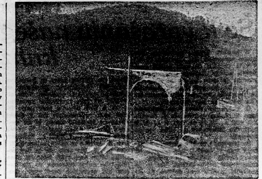
Vhod v prvi predor pri Dolju