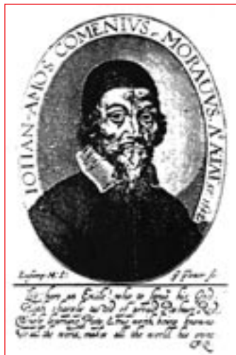
Jan Amos Komenský

in je bil nekaj časa poleg Biblije najbolj razširjena knjiga. V njem je Komenský izrazil načelo, da so besede brez poznavanja stvari le prazne lupine in zahteval učenje besed na podlagi spoznavanja stvari (različne latinske učbenike je zato potrebno ilustrirati s slikami dogodkov in stvari) ter učenje tujih jezikov na podlagi znanja maternega jezika. Ker je sloviti učbenik izšel brez slik, ga je bilo potrebno ilustrirati. Tako je nastal Orbis pictus ( Svet v slikah ), ki je bil prvotno name-