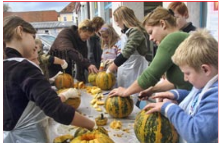
Otroci so pred nočjo čarovnic umetniško izrezovali buče.