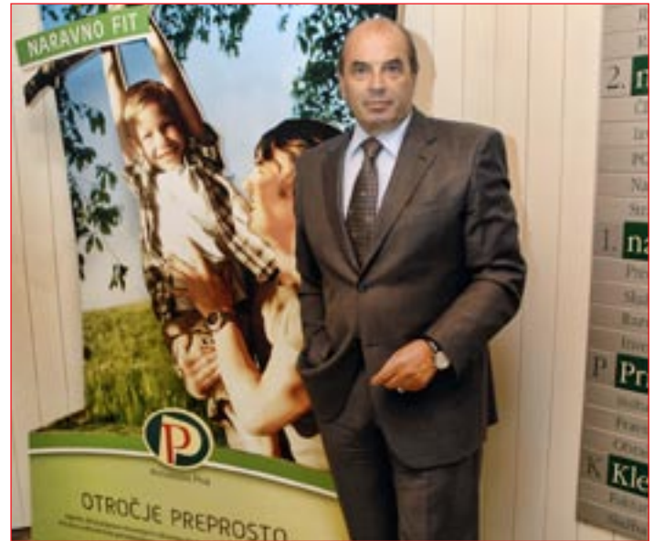
»V poslovnem okolju ni postavljenih nobenih meja. Postavljamo si jih samo mi sami, se z njimi spriznajmo ali pa jih spreminjamo.«

Perutnina Ptuj ima že v svojem imenu Ptuj in zaradi tega smo generatorji prepoznavnosti ter ugleda mesta, v katerem imamo svoj sedež. To velikokrat poudarjam tako doma kot v svetu, s čimer dajem svojevrsten prispevek Ptujem. Sem tudi zagovornik strategije, po kateri se tudi naša podjetja v tujini imenujejo vsaj v prvem delu enako kot matično podjetje; se pravi Perutnina Ptuj in v nadaljevanju npr. Beograd. S tem generiramo prepoznavnost Ptuja bistveno bolj kot kateri koli drugi poslovni sistem kjer koli na svetu. Seveda ni naša naloga, da bi širili vrednote zgodovine tega mesta. Lahko samo rečem, da smo Ptujem dali več, kot je Ptuj dal nam. Čeprav nikoli ne bom pristal na razprave o tem, kdo je v tem prostoru za prepoznavnost tega