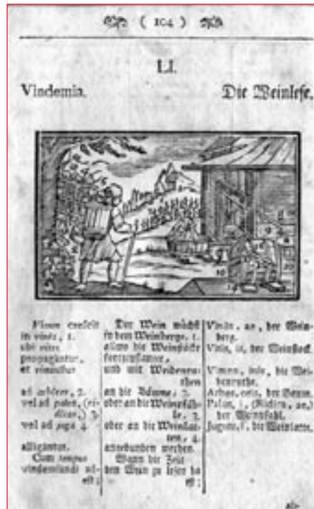
Komenský, Jan Amos: Orbis pictus , Wien, 1788, str. 104 (poglavje 51: Trgatev).