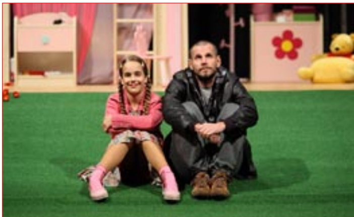
Iz predstave Smeti na luni.