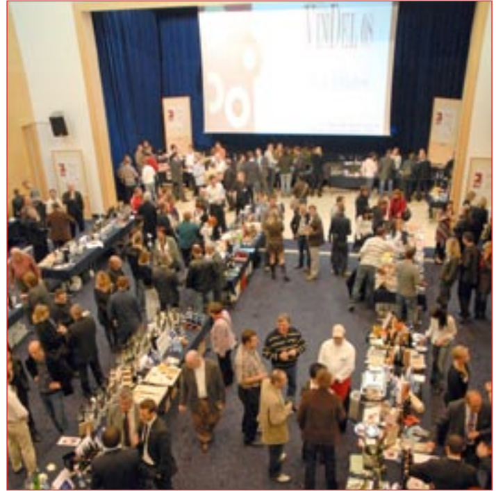
1. mednarodni salon vina in delikatesnih izdelkov VinDel 08 je dosegel rekordni obisk. Predstavljali so se eminentni pridelovalci iz Avstrije, Hrvaške, Italije, Francije, Španije, Švedske in vseh treh vinorodnih dežel Slovenije.