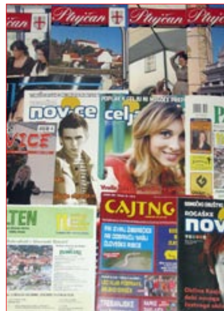
V Sloveniji je registriranih skoraj 300 lokalnih časopisov, glasil in revij. Seveda vsi ne izhajajo redno.

pluralističen način, zato se je zanjo treba vseskozi zavzemati, je opozoril. Konflikt med svobodo izražanja in interesom po uveljavitvi odgovornega izražanja odpira tudi vprašanje, kje je meja med primerno samoregulacijo avtorjev in kje se začne že nedopustna in nezazelenjena avtocenzura, je poudaril predsednik republike. To mejo je težko določiti, zlasti pri kompleksnih in občutljivih temah. Določanje te meje ostaja v prvi vrsti naloga vsakega pišočega človeka. Pri določanju te meje je po pred-