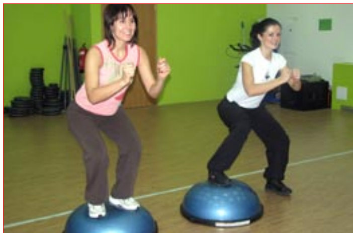
Bosu je sistem vadbe na polkrožni žogi.

V naslednji številki vam bomo med drugim predstavili skupinski vadbi cycling in aero boks in vas informirali o plesni rekreaciji.