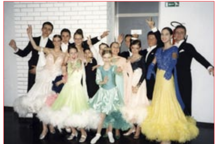
Po napornih in stresnih plesnih tekmovanjih smo se sprostiti in predvsem zabavali.