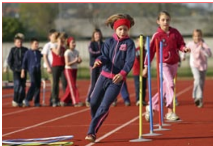
Vzdušje je med vadbami na atletski stezi zelo sproščeno, saj preko igre spoznavajo atletske discipline.

Za otroke vsako leto pripravijo mini tekmovanje, imenovano Mnogobojček, ki pa se ga na regijskem nivoju udeležujejo še otroci iz atletskih šol Maribor in Slovenska Bistrica. Mladi ptujski atleti pa se udeležujejo tudi Mnogobojčkov, ki jih organizirajo v Mariboru ali Slovenski Bistrici. Ta tekmovanja za otroke predstavljajo predvsem zabavno druženje z vrstniki. Pri dvanajstih letih, ko posameznik zaključí z atletsko šolo, si lahko v klubu izbere trenerja in nadaljuje svojo športno pot. Takrat so treningi že bolj intenzivni in prilagojeni posameznikovim psihofizičnim sposobnostim, počasi pa se tudi določi, v katero skupino bo spadal – bo tekač, skakalec ali metalec. Svojo športno pot otroci po končani atletski šoli lahko nadaljujejo v selekcijah Atletskega kluba Ptuj.