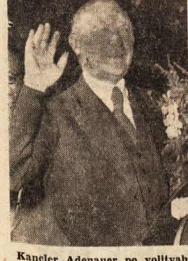
Kanceler Adenauer po volitvah

Berlin, 11. sept. (R). V zahodnoberlinskih političnih krogih menijo, da je reakcija Sovjetske zveze na izid volitev »mehkejša« kot so pričakovali in da je namenjena v glavnem kritiki delovanja kominformistične partije Zahodne Nemčije, ker ni imela do-