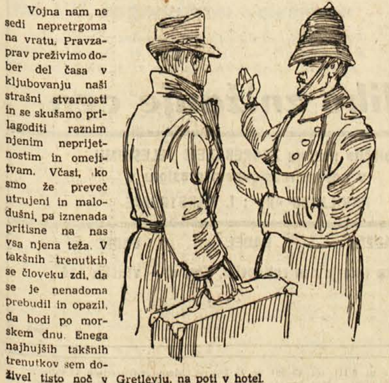
Bilo je tudi malo snega, toda videti je bil črn. V zraku sem čutil, da bo začelo znova snežiti. Zrak je bil vlažen in mrzel. Dvakrat sem začel v slepo ulico, dokler me ni končno policaj napotil na pravo pot.

Roman o nacističnem vohunstvu v Angliji med drugo svetovno vojno.