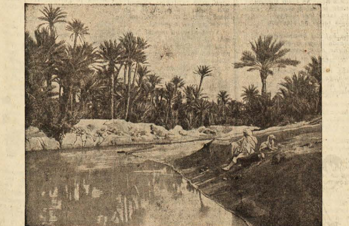
Oaza v Tunisu

Ameriško ministrstvo za narodno obrambo dobro ve, zakaj žrtvuje toliko denarja. Z Okinawe dosežejo reaktivna letala ter lahki in težki bombniki vse področje od Singapura do Kamčatke in vso Kitajsko tja do Sibirije, železniško progo »Turksib« in transsibirsko železnico, industrijske kombinat v Kuznecku in Irkutsku, Mandžurijo in Sinkjang, najvažnejše rusko pristanišče na Daljnem vzhodu Vladivostok in velike sovjetske vojne ladjedelnice v Nikolajevu.