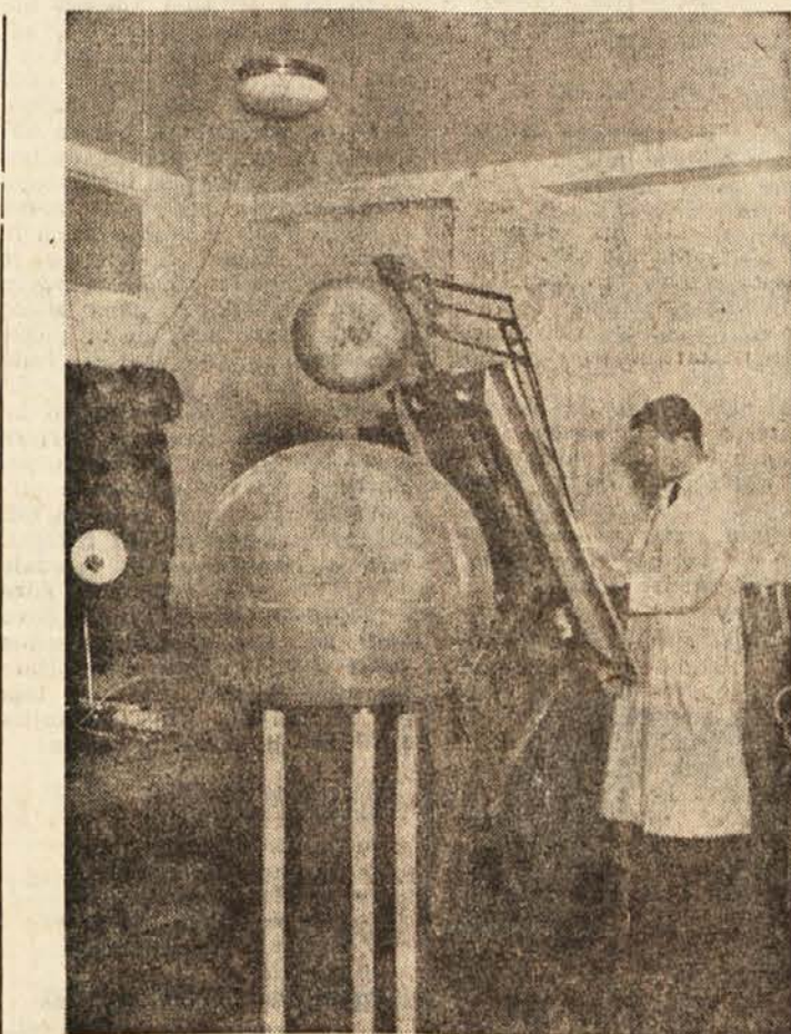
Visokonapetostni elektrostatični generator v fizikalnem inštitutu v Ljubljani

Svet je sklenil zgraditi potrebne znanstvene laboratorije za potrebe vseh včlanjenih držav, in sicer v Ženevi. Ustanovitev ženevskega inštituta ni bistveno zavlekla akcija švicarske Informbirojske Stranke dela, ki je zbrala v ženevskem kantonu od lahko vernih ljudi potrebne podpise proti takemu inštitutu na področ-