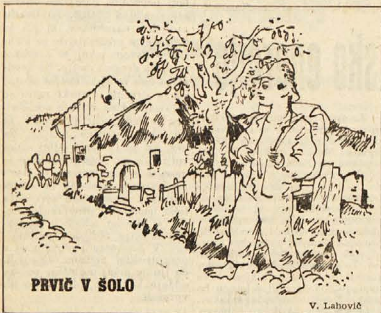
PRVIČ V ŠOLO