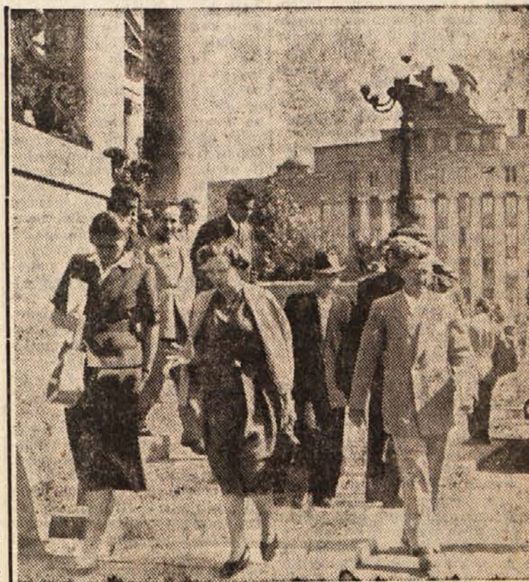
Ljudski poslanci odhajajo iz poslopja Zvezne ljudske skupščine