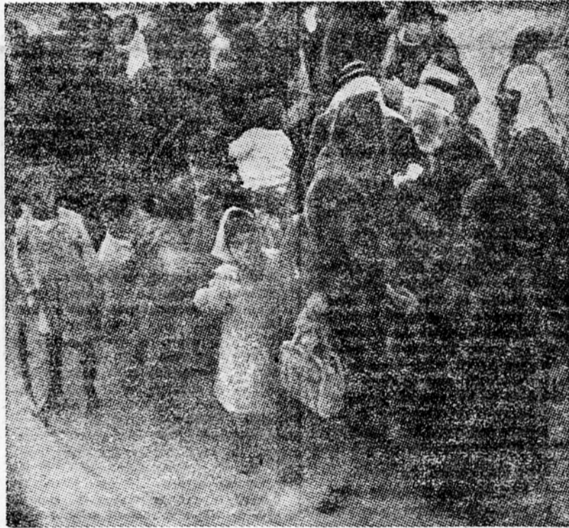
Silka prikazuje arabske družine, ki so se zbrale v mestu Acre v državi Izrael. Za vojne med Arabci in Zidi so bile te družine razdeljene: na tisoče žena in otrok je zbežalo iz vojnih področij, medtem ko so moške ostali. S posebnim dovoljenjem izraelske vlade se je kakih 35.000 žena in otrok vrnilo iz emigracije na domove. Cenijo pa, da je še približno 600.000 beguncev, ki jih ta sreča ni doletela. Ti ljudje še vedno živijo v duplinah in pod sotorti vzdolž izraelske meje. Sporazum med Izraelom in Jordanom naj bi rešil tudi to vprašanje.

Hkrati je poslal ameriški visoki komisar Mac Cloy večeraj odgovor na Adenauerjevo pismo, v katerem je bilo rečeno, da je nemška zvezna republika edini zakoniti predstavnik nem-