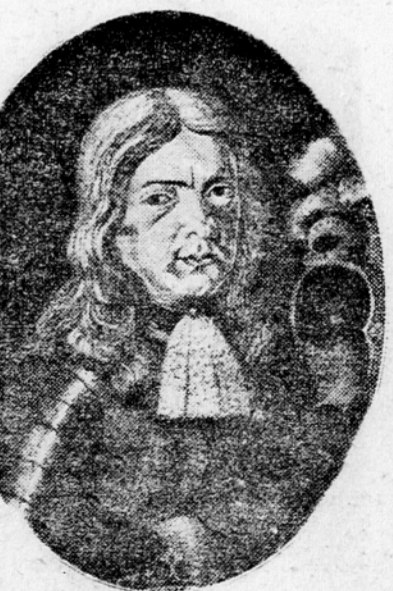
Janez vajkard Valvazor.