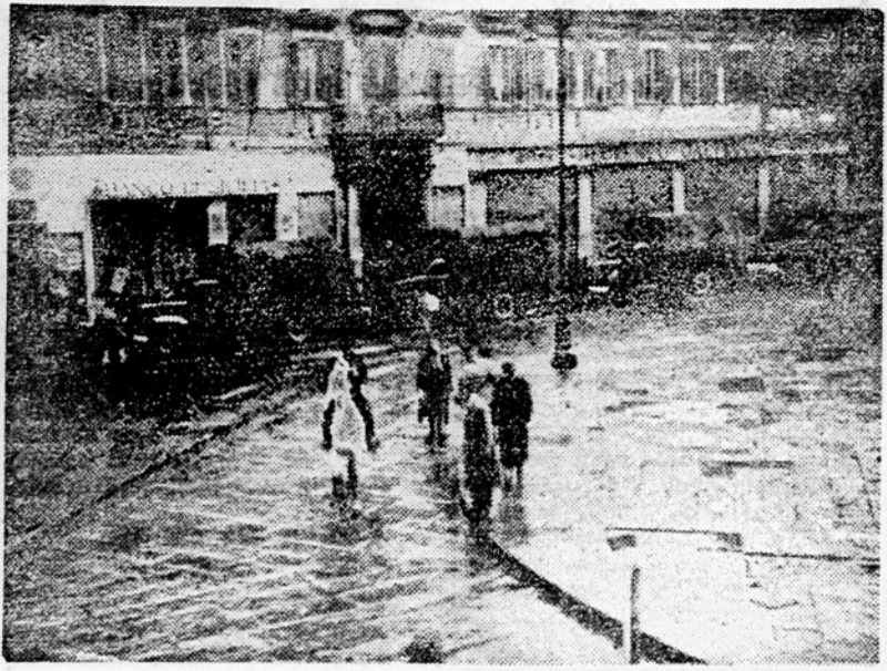
Trst, 20. febr. Tržaški radio poroča, da je bila danes končana stavka industrijskih delavcev, ki je trajala tri tedne.

Za stavke tržaških industrijskih delavcev, posebno pa v dveh dneh, ko je trajala splošna stavka, je bila vsa tržaška civilna policija ob pomoči