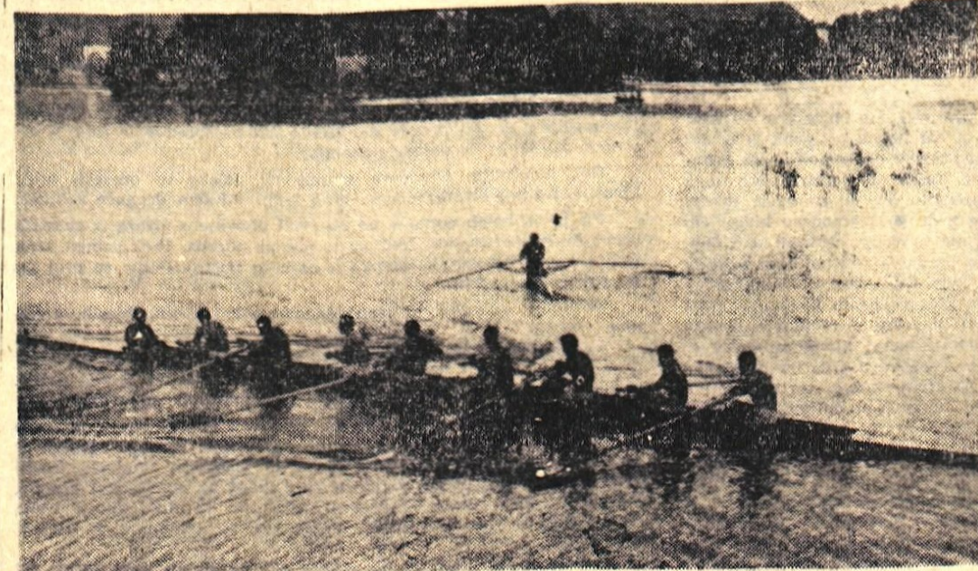
Mladinci blejskega osmerca v soboto niso nastopili

Danes dopoldne je bil na Hrušiči kros za pokal talcev okoli zasedene Hrušice. Nastopilo je 13 ekip. Rezultati so naslednji: člani — 1. Jesenice, 2. JLA Hrušica, 3. Partizan Hrušica itd., mladinci — 1. Partizan Hrušica, 2. Jesenice itd., mladinke — 1. Partizan Hrušica, pionirji — 1. Partizan Hrušica itd. — U.