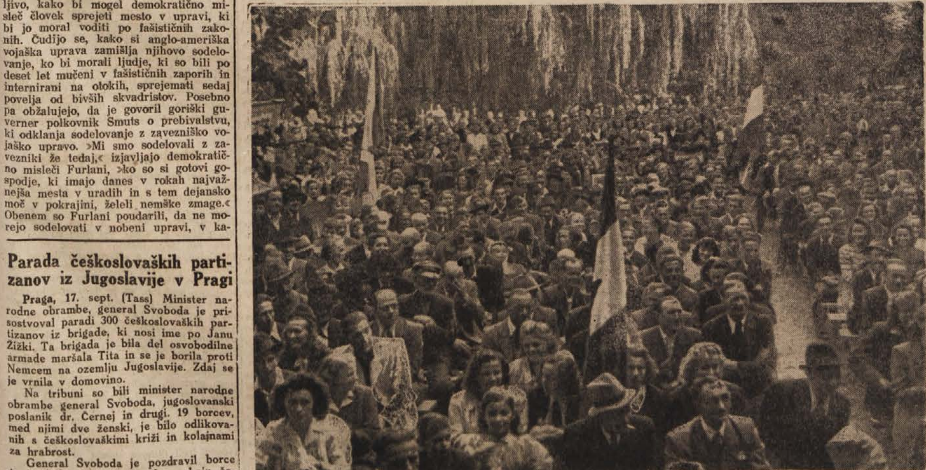
Veliko število volilcev se je zbralo na predvolivnem zborovanju v Celju.

Graditev mostov na progi Banja Luka—Obodnik se je pričela 1. julija t. l., ko so kmetje posekali potrebni les za mostove. V 2 mesecih je bilo zgrajenih 11 velikih in nekaj manjših mostov, za katere so računali, da jih bodo gradili najmanj 3 mesece. To je tem večji uspeh, ker je bilo zaposleno pri teh delih razen 4 mojstrov samo majhno število nestrokovnih delavcev. Razen tega ni bilo niti dovolj orodja niti materiala.