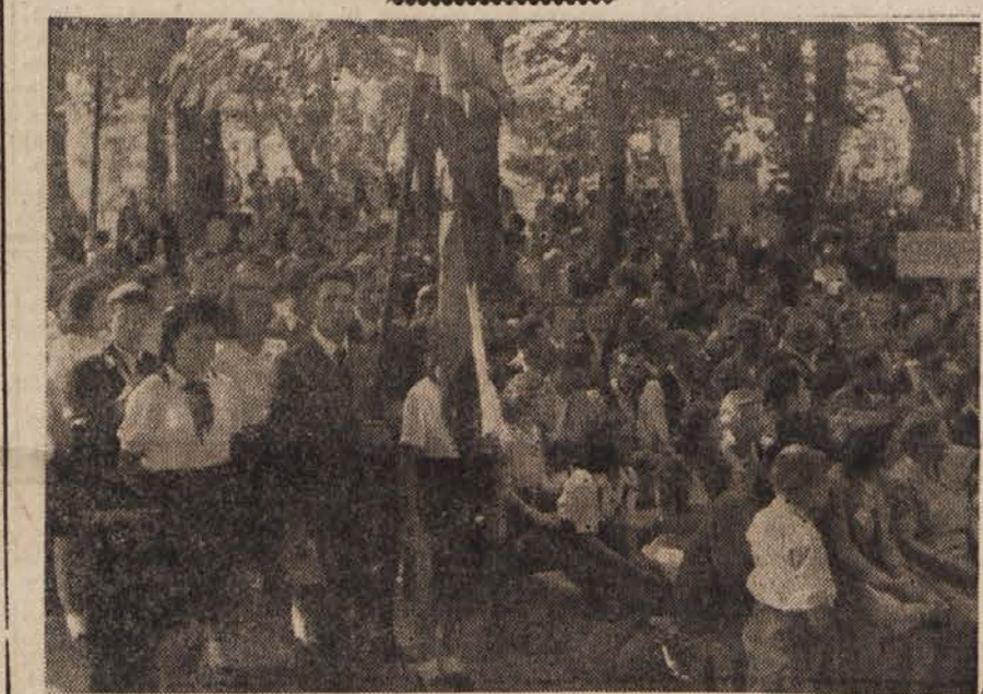
V velikem številu so se Brežičani udeležili predvolivnega zborovanja.