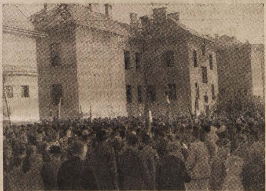
Predvolivno zborovanje v Ribnici.