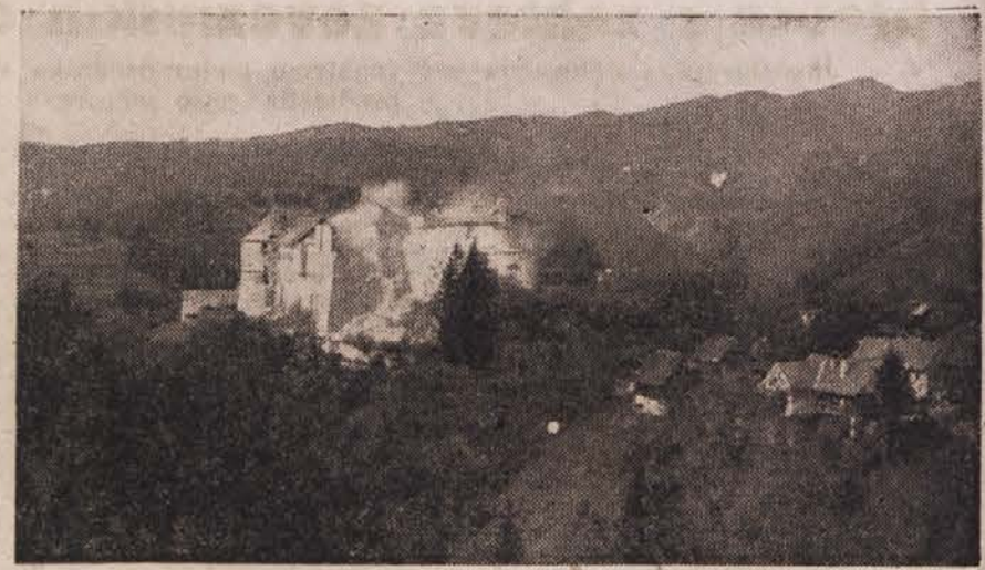
Turjaški grad, belogardistična trdnjava, po zavzetju.

Po kapitulaciji Italije je naša vojska v nekaj dneh razorožila okupatorsko vojsko in osvobodila skoraj vso Dolenjsko, Notranjsko in večji del Primorske. Belogardistični izdajalci, ki so do tedaj vedrili pod zaščito italijanskih okupatorjev, so takrat na lastni koži občutili preprosto resnico, da je vsakdo, ki ni povezan s svojim ljudstvom, ne uživa njegove podpore in se bori celo proti njegovim koristim, nujno obsojen na propast. Ko so poraženi italijanski okupatorji klavarno odhajali domov, so se belogardisti, njihovi dotedanji varovanci, razbežali, ponekod pa se v svojem obupu zaprli v utrajene postojanke in čakali na svoje nove hitlerjevske zaveznike.