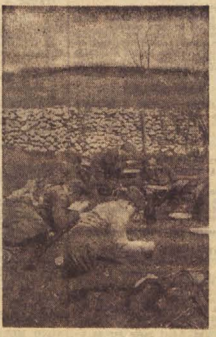
Skupina borcev Kosovelovce brigade