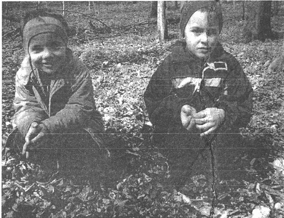
Učenci 1. razreda devetletke: »Bili smo v kraljevstvu vijolic.«

Odrasli smo jim s svojim delom in ravnanjem z okoljem zgled. Ne bodo delali, kot jim bomo rekli, temveč tako, kot bodo videli delati nas. Starši, stari starši in sorodniki so prvi vzgojitelji in prvi zgled otrokom, vsi skupaj pa skrbimo za svoje počutje in počutje naših otrok, posredno pa še za počutje vseh znančancev.