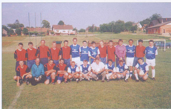
Na Hodošu se mlado in staro za žogo podi