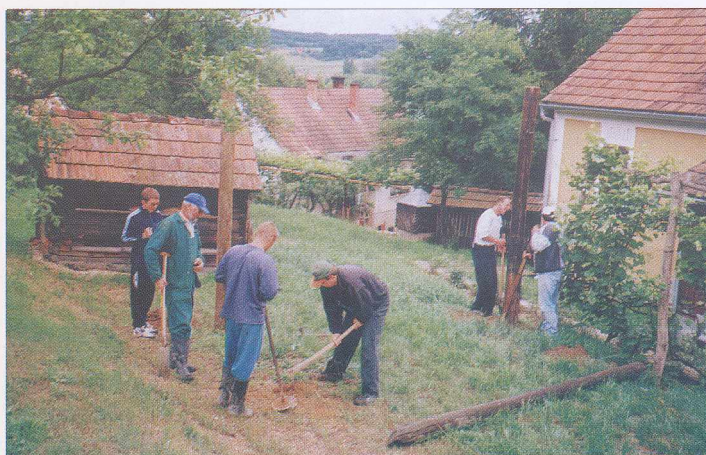
Épül a domaföldi temetőház