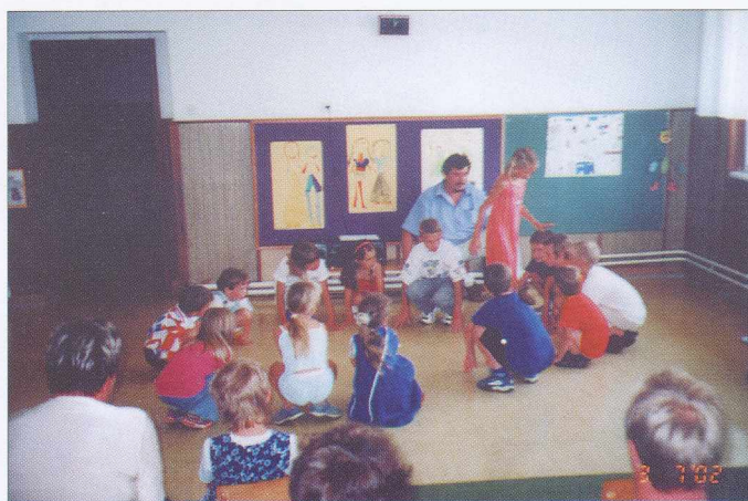
Utrinki z zaključne prireditve Pillanatképek a zárórendezvényről