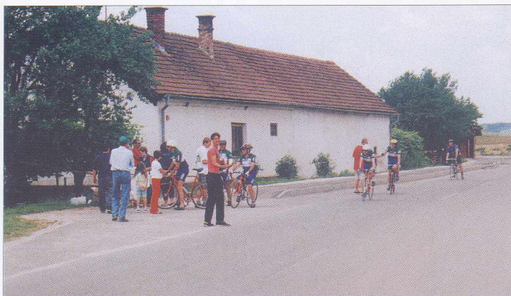
Udeleženci kolesarskega maratona na Hodošu