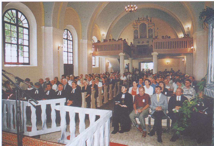
Svečanost ob 160. obletnici evangeličanske cerkve in posvetitvi orgel