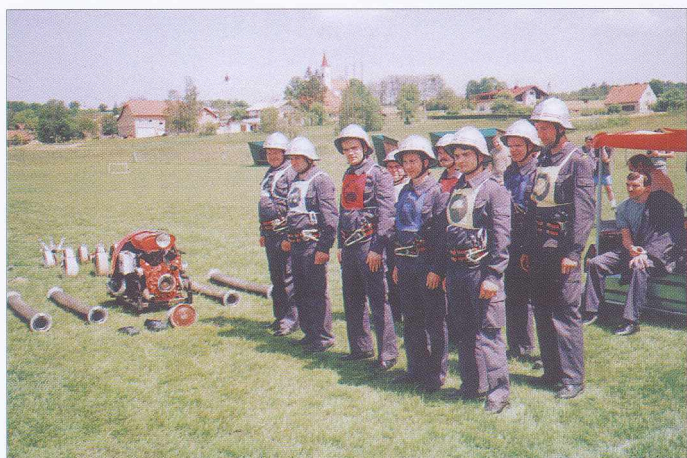
Članice in člani pred vajo