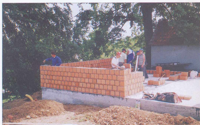
Gradnja mrtvaške vežice na Domaföldu