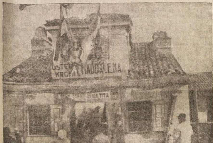
V magdalenskem predmestju so ljudje okrasili svoje hiše s slikami maršala Tita in tovariša Kardeja ter z jugoslovanskimi zastavami.