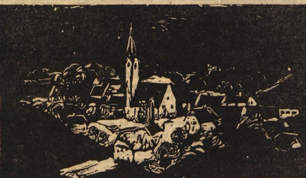
Lojze Sušmelej: Radlje ob Dravi

Običajno vprašanje, vendar prav za nasad v Radljah nadvse važno. Predvsem nastopajo težave pri plačevanju delovne sile. Ko sva hodila med polji,