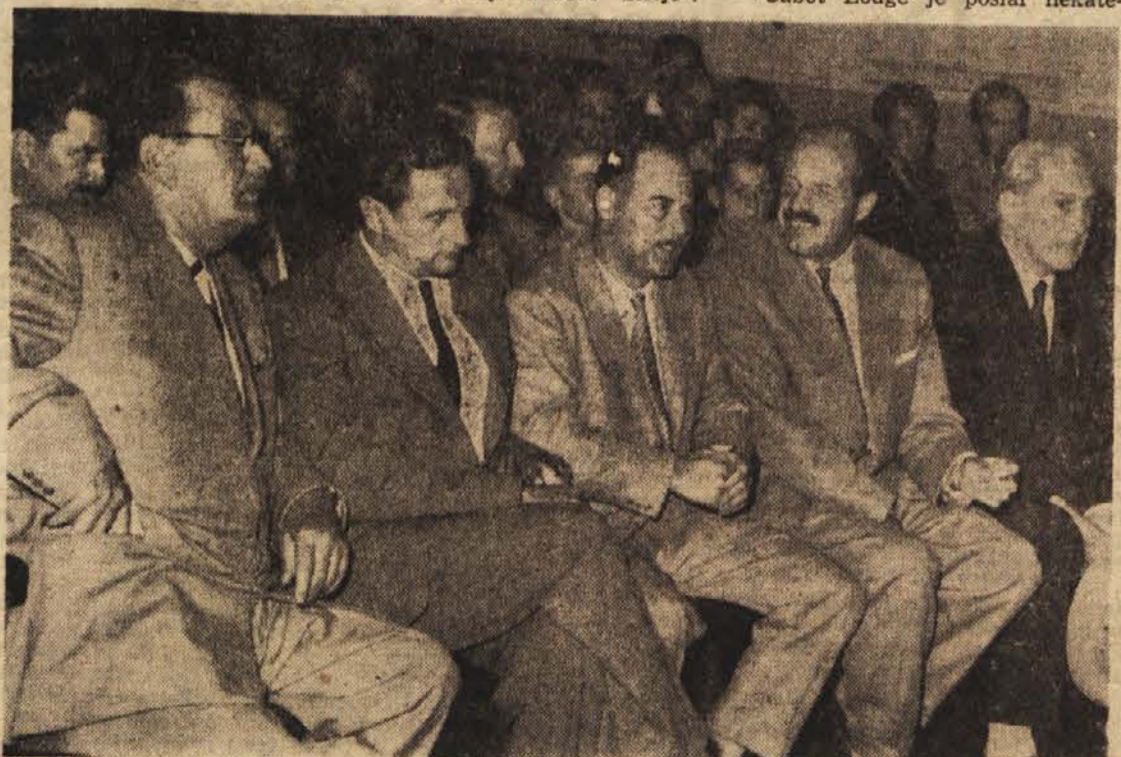
Z včerajšnje slavnostne seje delavskega sveta v Litostroju

Sodeč po egiptovskih virih bi lahko pričakovali, da bo Sirija na bližnjem sestanku odbora načela vprašanje »vmešavanja ZDA v notranje zadeve Sirije«.