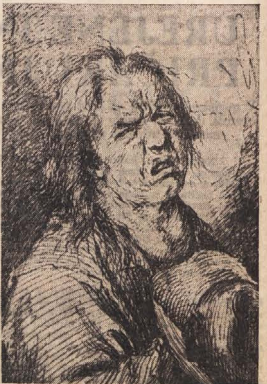
M. J. Kremser Schmidt: Revščina me muči