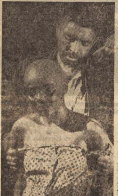
Prizor iz ameriškega filma o rasni diskriminaciji v - Afriki