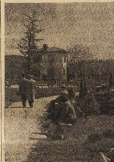
Park v Novi Gorici