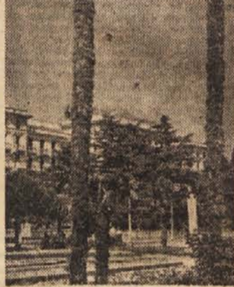
Motiv iz Portoroža

Pred nedavnim se je sestala komisija, v kateri so bili zastopniki sekretariata Izvršnega sveta za blagovni promet, Turistične zveze Slovenije, Putnika, SAP-Turist biroja, Uprave za ceste LRS, Okrajne ljudske odbora Gorica in bovske občine. Na podlagi ugotovitev komisije, ki je pregledala vso cesto, bodo pripravili načrte za modernizacijo in rekonstrukcijo, zlasti na ovinkih, ki so za težja vozila dokaj nevarni.