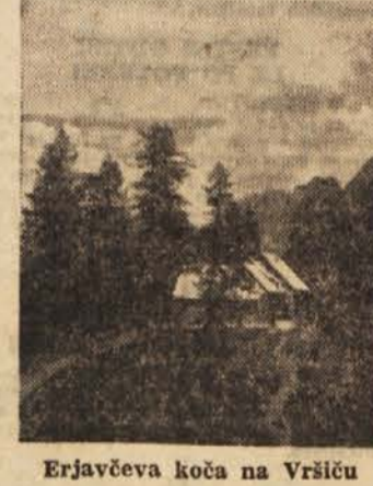
Erjavčeva koča na Vršiču