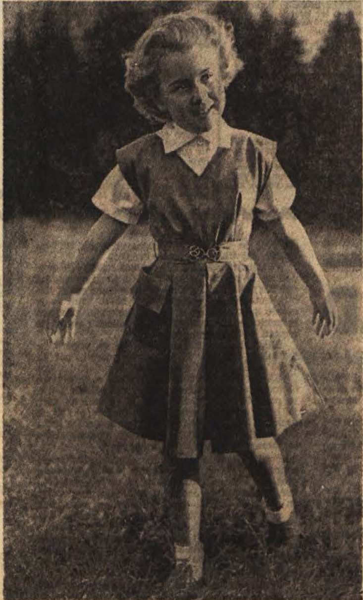
Halja, ki jo nosi deklica, je prav primerna za našo šolarko. Če hočemo, ji lahko napravimo tudi dolge rokave