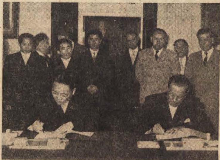
V petek je bila v Beogradu podpisana skupna deklaracija vlad MLR in FLRJ. V imenu Jugoslavije je deklaracijo podpisal predsednik republike Josip Broz Tito, v imenu Mongolije pa predsednik ministrskega sveta Jumžagin Cedenbal

Sofija, 31. avg. (Sofija). V Sofiji je danes dopoldne prispela delegacija Mongolske ljudske republike s predsednikom vlade Jumžaginom Cedenbalom na čelu. Na sofijskem letališču so priredili delegaciji svečan sprejem, ki so mu prisostvovali predsednik bolgarske vlade Anton Jugov, prvi sekretar CK KP Bolgarije Todor Živkov in drugi bolgarski državni in partijski voditelji.