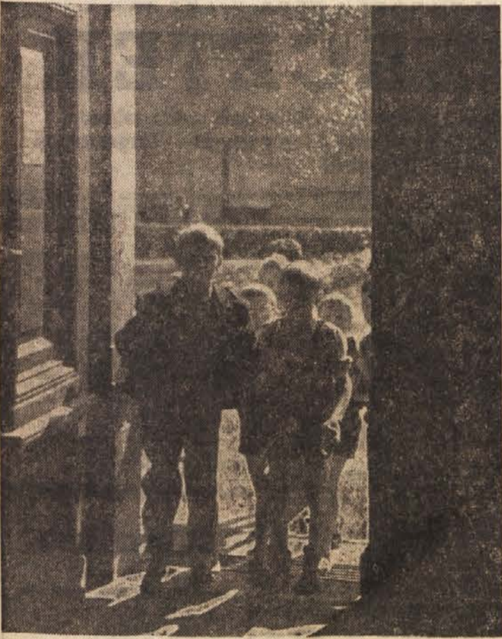
Se nekaj dni pa jih bomo spet srečavali med šolskimi vrati