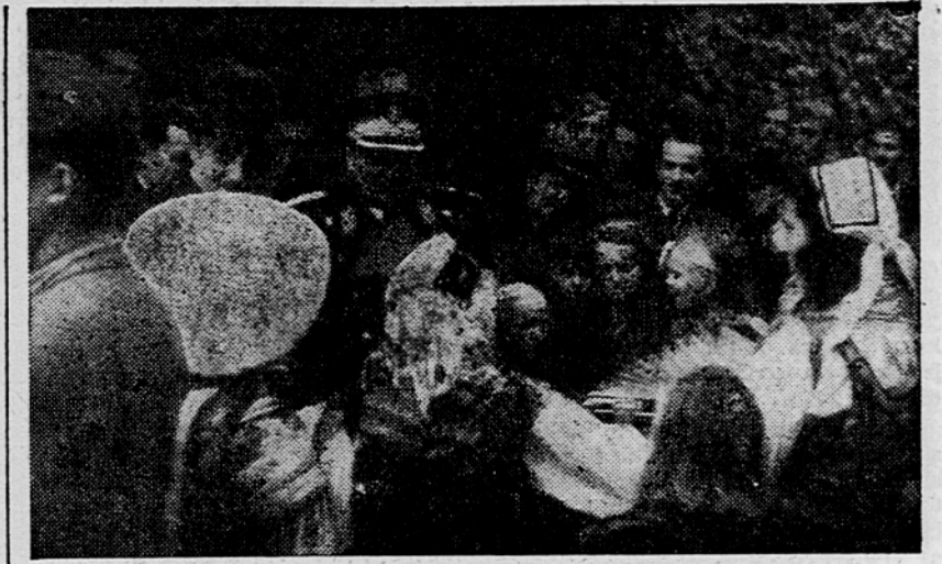
Poljski gostje in maršal Tito poslušajo na Bledu pred hotelom »Toplice« veselo pesem pionirjev in pionirk

Ganjen se je maršal Tito zahvalil za dar in se v svojem nagovoru ladjedelničkim delavcem spomnil skupnega dela in trpljenja v času izkoriščanja v stari Jugoslaviji. Po-