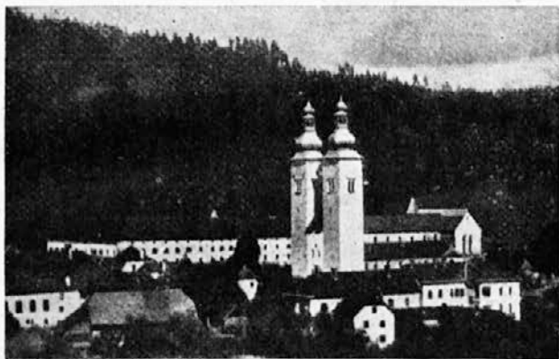
Krška stolnica, kjer počiva telo sv. Eme

se nanjo vsede v trdni veri, da mu bo sv. Ema spolnila tisto željo, ki jo bo takrat gojil v svojem srcu. Tu je torej sedela modra kneginja in stalno nadzirala delo. Tu je mojster pred njo razgrinjal svoje načrte, sem so hodili graditelji po nasvete. Na tem kamenitem stolu sede je plemenita žena vsak večer plačevala delavce. V rokah je držala denarnico in po predloženih računih delovodje dala vsakemu zasluženo plačilo. Tako je vedno višje rasla proti nebu stavba: cerkev in samostan, ki ju bo pobožna kneginja posvetila Mariji.