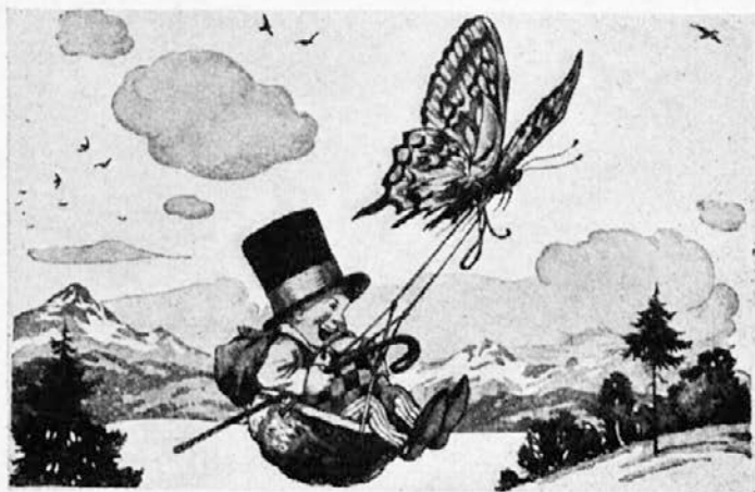
Aeroplan je švignil v višave.

modra misel pridel žal prepozno. — Tedaj pa je zaslišal zvonki glasek: »Balonček! Balonček!« Pogledal je v smer glasu in zazrl ne daleč družinico gob. Urno jo je ubral tja in dobil pod mogočno streho največje gobe prav dobro obrambo proti vsiljivemu dežju. Gobice so bile nenadnega gosta zelo vesele in ko jim je z veliko vnebo razlagal