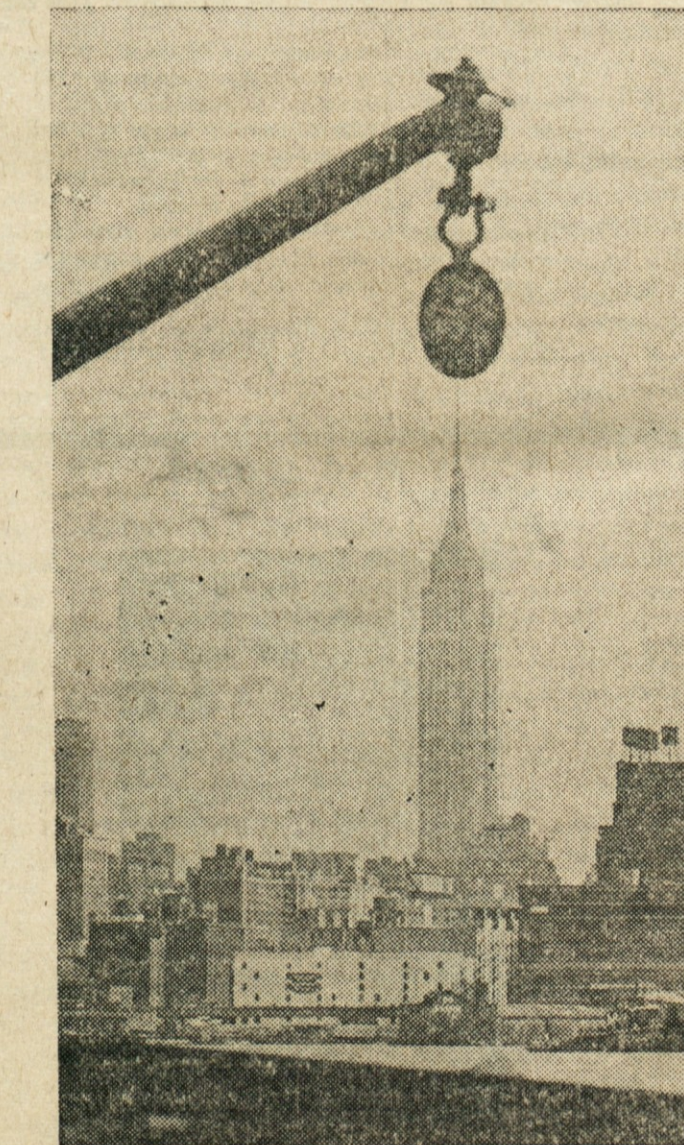
EMPIRE STATE BUILDING V NEVARNOSTI? — Po sliki sodeč, bi se utegnila težka krogla spustiti na Empire State Building v New Yorku, pa ne bo nič hudega. Zerjav s kroglo je precej daleč stran v New Jerseyju, tako blizu donebnika ga je spravil samo fotograf.