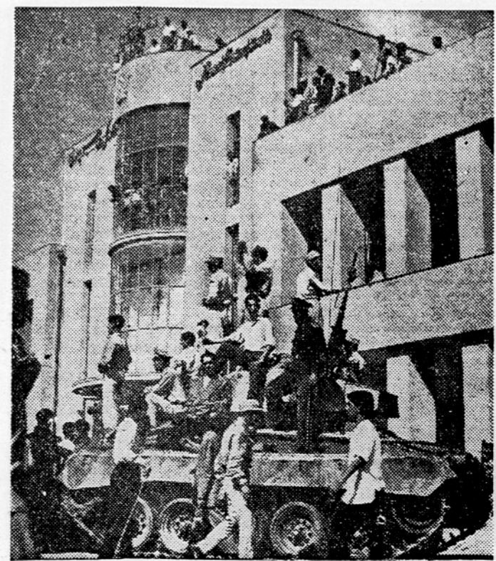
Po ulicah Teherana patroliralo tanki

New York, 30. avgusta. Sekretariat OZN je objavil, da je 15 v Organizaciji združenih narodov včlanjenih držav že popolnoma poravnalo svoje članske prispevke, kakršni so bili določeni v proračunu za letošnje leto. S temi vplačili je dobil sekretariat 25% svojih proračunskih dohodkov. Vse članske prispevke so poravnale naslednje države: Afganistan, Kanada, Costarica, Danska, Dominikanska republika, Islandija, Indonezija, Luksemburg, Saudska Arabija, Siam, Venezuela, ZDA, Liberiija, Norveška in Južnoafriška unija. Dosljedolguje sekretariatu OZN na članarini največ ZSSR — 2.949.452 dolarjev, najmanjši dolžnik pa je Burma z 8.065 dolarji.