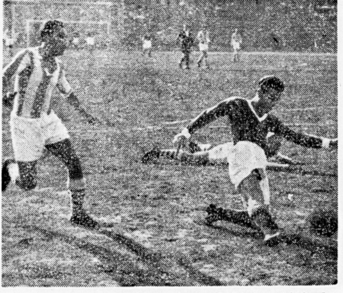
Ze v 10. minuti je kazalo slabo za domače; Proleter je nšel Osredkema (na tleh) in Pelicova ob njem, toda na srečo je šla žoga mimo...