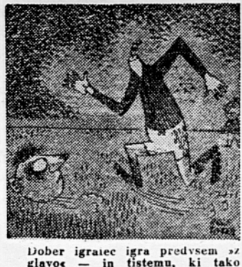
Dobro igralec igra predvsem z glavom - in tistemu, ki tako ravna, uspeh ne more biti...