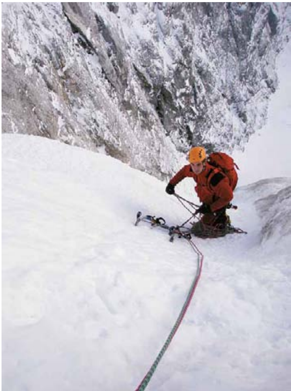
V spodnjem delu grape med Travnikom in Šitami