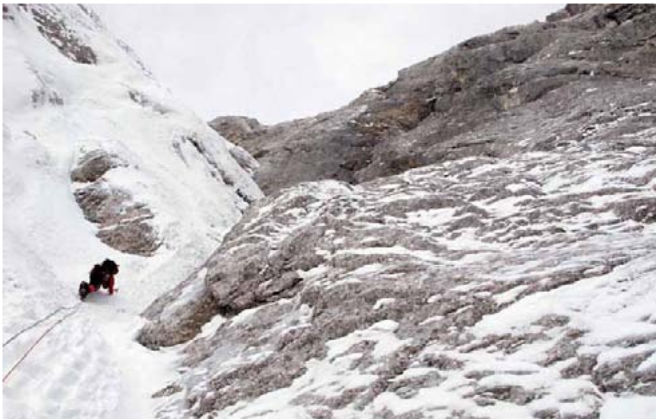
Začetek Grape med Travnikom in Šitami