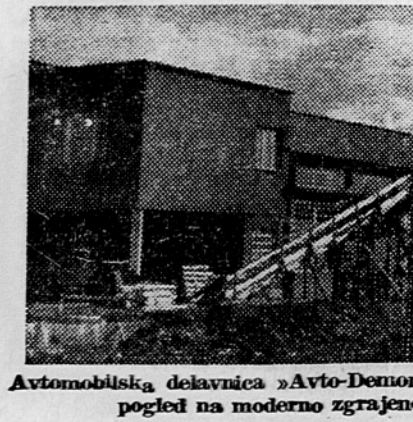
Avtomobilski delavnic »Avto-Demont« v Dubravi pri Zagrebu. Zunanji pogled na modernu zgrajeno in opremljeno delavnico.