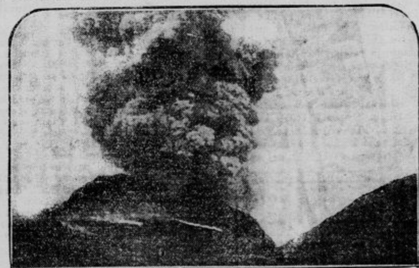
Erupcija vulkana Tokachi na Japonskem

morsko kupališče, letovališče. Sezona započela. Hoteli, pensioni te iskuhavaone otvorene. Vrejenje vrlo podesno. Cene umierene. Sve ustie daje Licilšišno povjensivo u NOVOM.