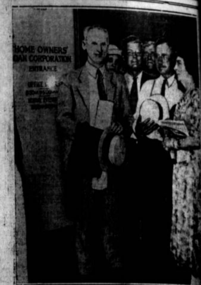
Naval množice hišnih posestnikov v Detroitu, ko je na posojilna korporacija odprla prvi urad tamkaj. Na detroitskih mahih posestnikov je v stiskah za denar.

— Cel mesec sem iskal, da sem našel magnet za bacile. Sa-