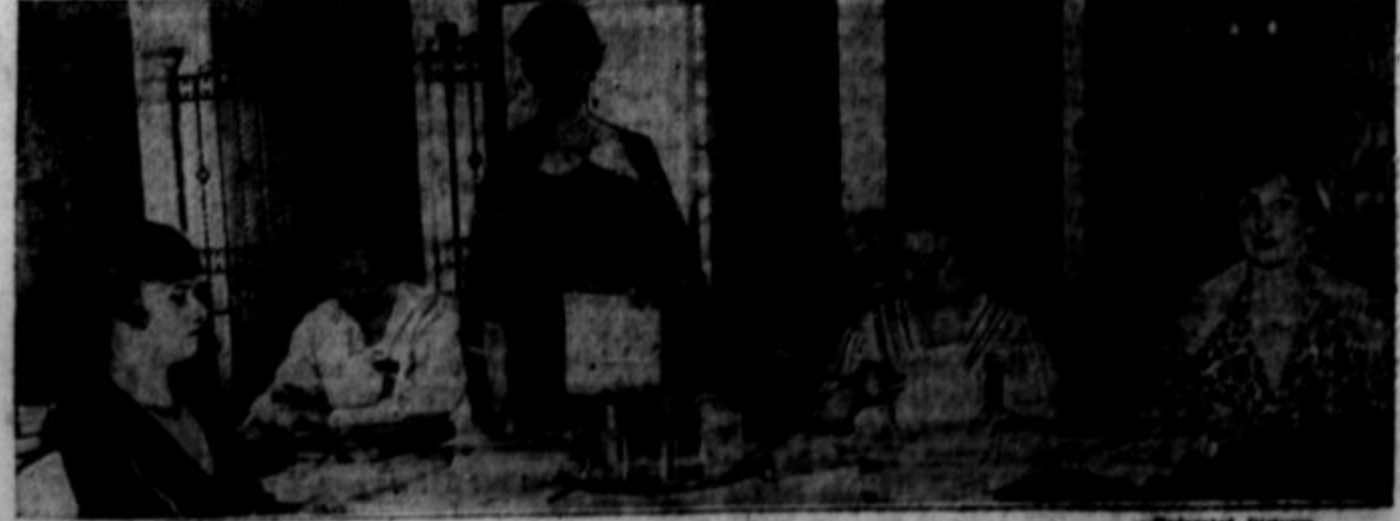
Eksekutivni odbor nove reakcionarne ženske organizacije National Federation of Business and Professional Women v Chicagu.