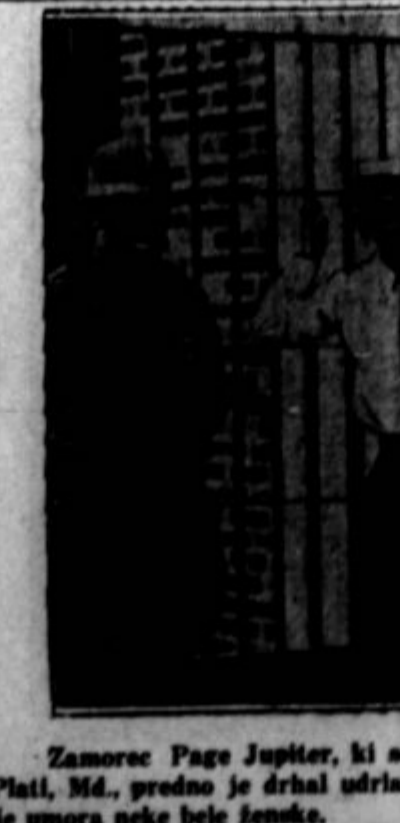
Zamorec Page Jupiter, ki so ga jezarji režili iz ječe v La Plati, Md., predno je drhal udria v zapor, da ga linča. Obtožen je umora neke bele ženske.

Philadelphia, Pa. — Dne 29. in 30. julija bo v tem mestu di- striktna socialistična konferen- ca, na kateri bodo razpravljali o novem industrijskem zakonu in o taktiki ter metodah za or- ganiziranje delavcev v unije. Glavni namen ankete je, uspo- biti in navdušiti člane stranke za čim večjo aktivnost na stro- kovnem polju in podčrtati njih nalogo v unijah. Ankete se u- deležijo prominentni socialistični in unijski voditelji. Slične kon- ference bo stranka obdržala tudi v drugih krajih dežele.