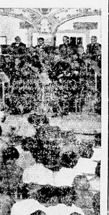
S sinočnjim simfoničnim koncertom Orkestra Slovenske filharmonije pod vodstvom dirigenta Lovra Matačiča v predverju Krizank je ljubljanski festival zaključil svoj letošnji bogati in pestri program. Pod mojstrstvom in občutenim vodstvom dirigenta je orkester Slovenske filharmonije zelo lepo podal Brahmov Prvo simfonijo in Čajkovskega Peto simfonijo. Ob izvedbi, zlasti še lirčno, a hkrati zmogljivo prodorno simfonijo Čajkovskega je občinstvo nagradilo s toplim odobravanjem. Zal le, da so bili poslušalci zaradi ne najboljše akustike koncertnega prostora prikrajšani za marsikatero fino izvedbo.

Od slovenskih umetniških filmov so trenutno že prodali na Vzhodu in na Kitajsko »Kekca« in »Trenutke odločitve« za 25 milijonov dinarjev. Za »Trenutke odločitve« in »Vesno«, bo kot vse k že, Sovjetska zveza plačala 30 milijonov dinarjev. »Vesna« je bila prodana na Madžarskem, Poljskem in Vzhodni Nemčiji za 12 milijonov dinarjev. Na svoji zemlji na Madžarskem za 4 milijone dinarjev in »Kekca« istotam za isto voto, »Trenutki odločitve« pa v Bolgariji za 2 milijona dinarjev.