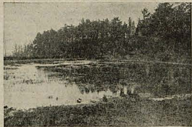
Čeprav leži Komen sredi Krasa, ki je sleer brez vode, ima vendarle izredno posebnost: svoje jezero. Na sliki kraško jezero pri Komnu

Šakal spada v vrsto psov, katerih domovina je Azija, v Evropi pa živi največ na Balkanskem polotoku. V Jugoslaviji je bil včasih na nekaterih področjih v Dalmaciji in Makedoniji, zdaj se pa pojavlja še tudi drugod.