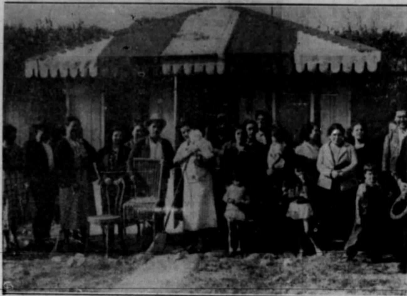
Mehiška vlada je prevzela v Agual Caliente v svojo posest hotel, da ga pretvori v šolo za operatorje stroplanov. Delavcem hotela ta kajpada ni moglo biti všeč in so začeli demonstrirati proti vladi, ker jim je odjedla kruh. Na ulici so nameščenci dotičnega hotela svojimi otroci. Vlada jim je obljubila nove službe.