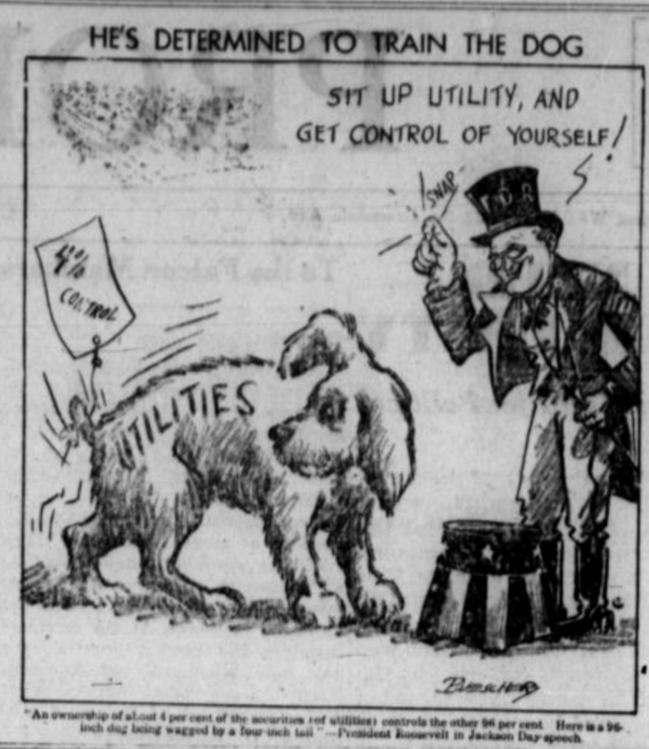
An ownership of about 4 per cent of the securities of utilities controls the other 96 per cent. Here a 96-inch dog being waggled by a four-inch tail. (Published hereafter in Jackson Day speech.)

Ampak iz izkazov, ki so jih odborniki korporacij mora-i predložiti zveznemu davčnemu uradu o svojih plačah, je raz-vidno, da jim ni sile.