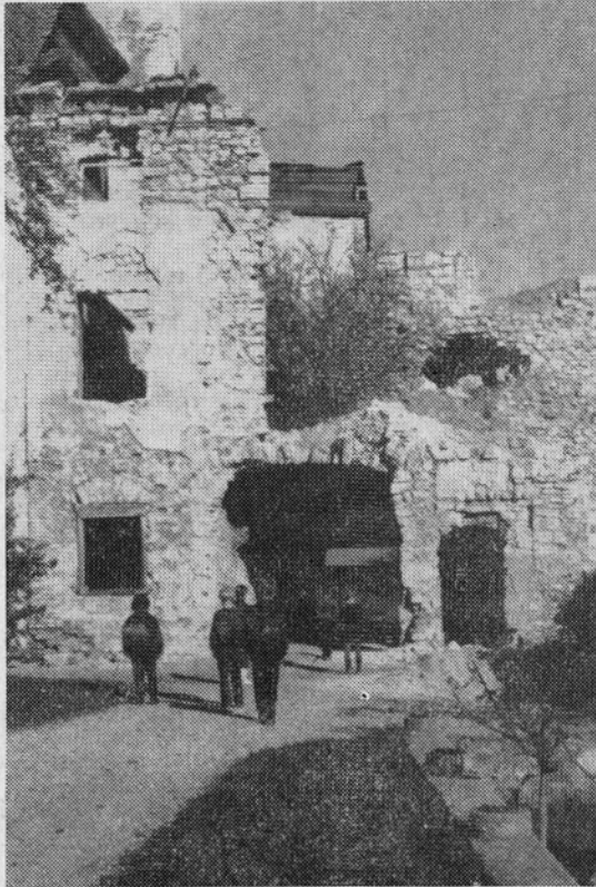
Ostanki jurkloštrskega gradu

šal Zavod za spomeniško varstvo v Celju in s svojo intervencijo prekinil začeto delo.