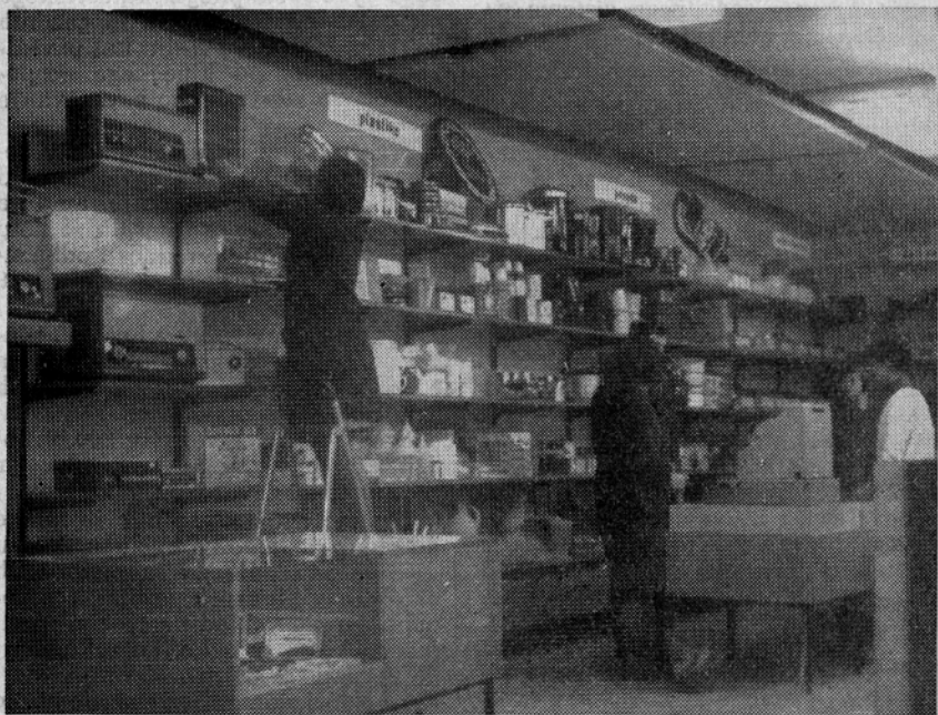
Trgovsko podjetje »MERX« je v Laškem odprlo novo specializirano trgovino železnino, stroji in gospodinjstvo opremo

Upravičenec praviloma pridobi pravico do otroškega dodatka, ko z zaposlitvijo s polnim delovnim časom dopolni 6 mesečno neprekinjeno delovno dobo. Če je pa upravičenec edini hranilec svojih otrok, pridobi