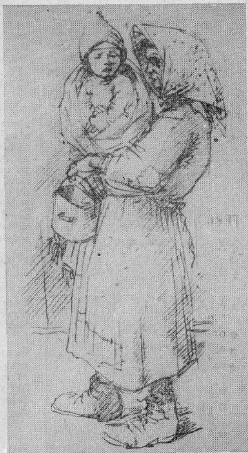
NIKOLAJ PIRNAT: SLOVENSKE MATERE V INTERNACIJI

V trpljenju, ob pomanjkanju in poniževanju, s svetlimi upi na zmago so ohranile svojo berbenost in ljubezen do domovine tudi naše žene