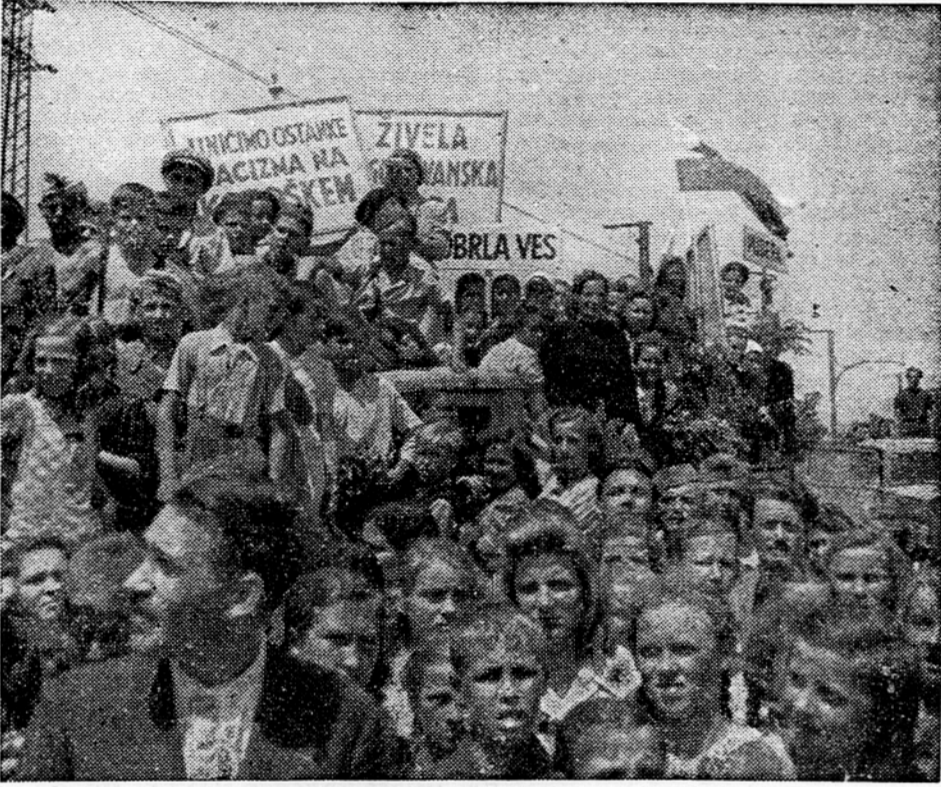
Korosice iz vseh krajev Korotana so prinesle borbene pozdrave drugemu kongresu SPZZ