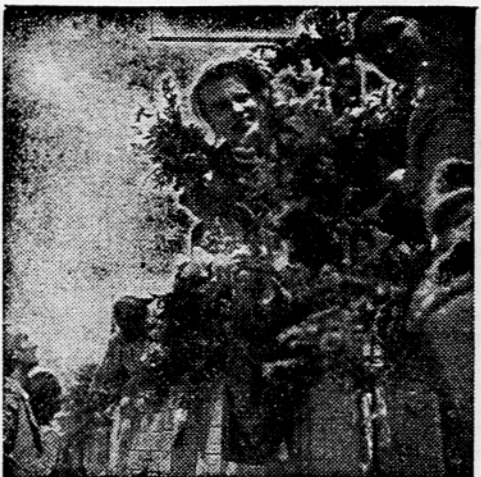
Kamijon, s katerim so prispele delegatke iz Korosice na drugi kongres SPZZ, so nanotice vse pot zastavale s cvetjem