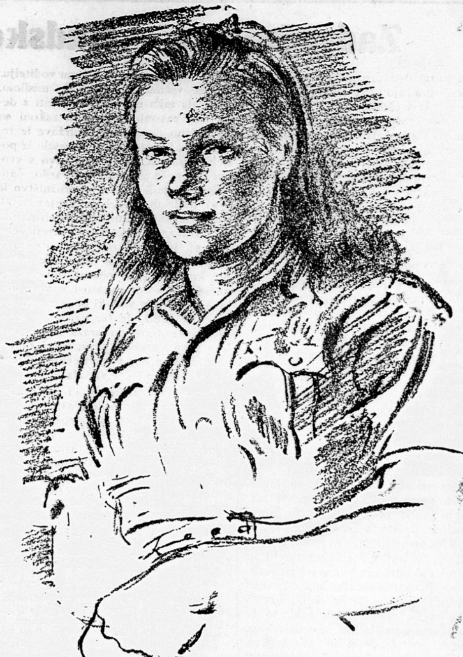
Fr. Mihelič: Partizanka-bolničarka