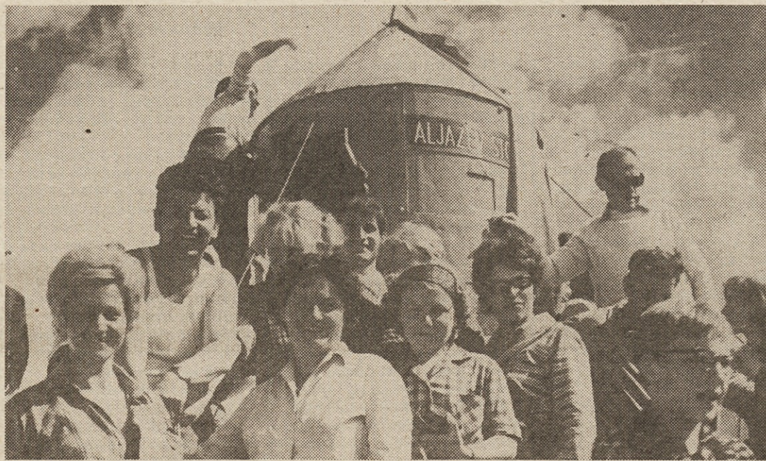
Jeseniški železarji so tudi navdušeni planinci. Redno med drugim obiskujejo tudi Triglav, na katerega se bodo letos povzpeli organizirano že desetič!

Ze lani so se jeseniški železarji odločili, da bodo znova usposobili počitniški dom na bližnji Mežakliji, kjer so idealni pogoji za oddih ljudi, ki si žele miru in svežine gozdov. Ker pa velikega po-