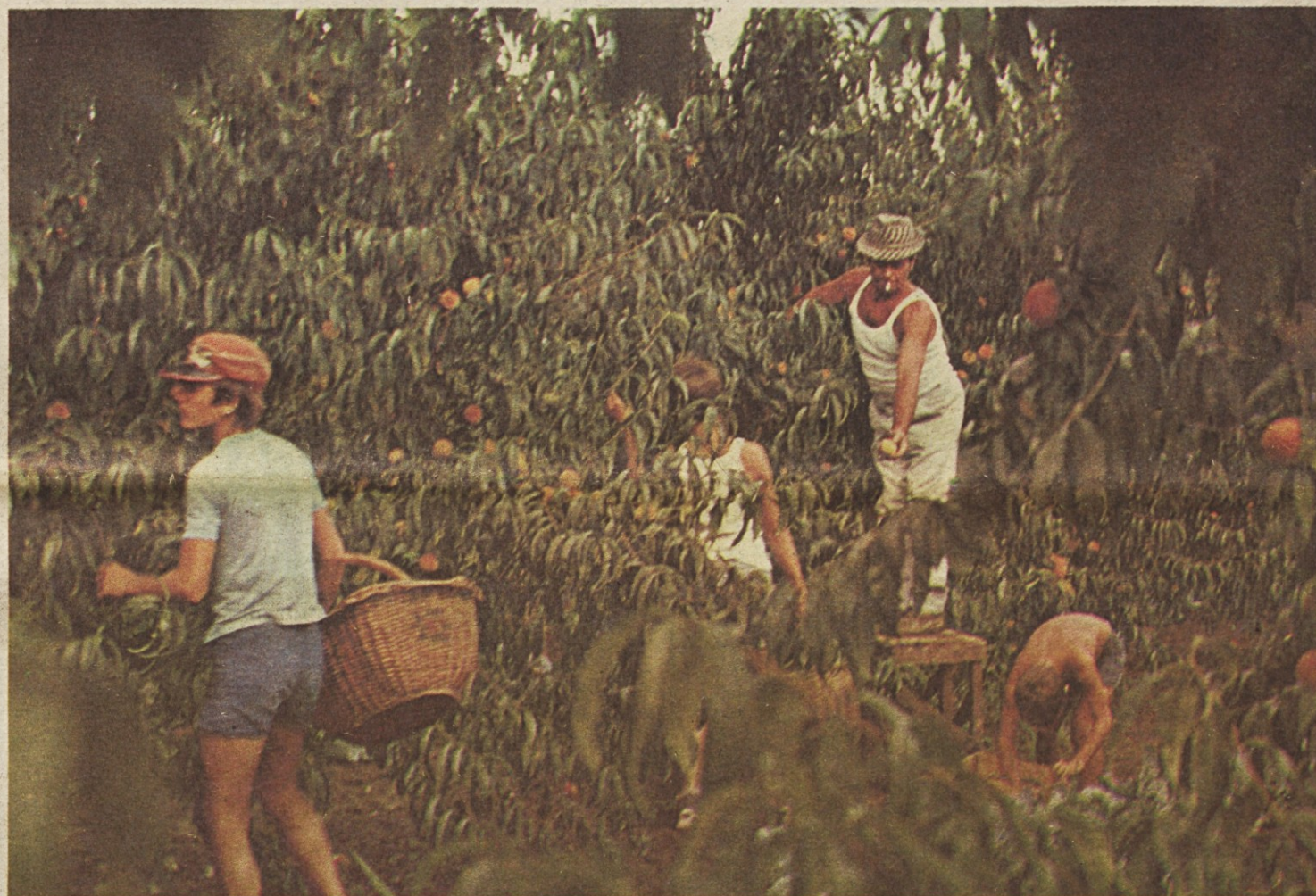
Razdrobljeno gospodarjenje ne daje dobrih sadov. Moč je v skupnosti. O izkušnjah kmetov iz Dornberka na Vipavskem berite na 5. strani.

Opora pri uresničevanju teh nalog je spoznanje, da je gibanje nevrščnosti v svojem dosedanjem razvoju, v svoji nezadržni rasti zgradilo svoj skupni svetovni nazor. Na podlagi tega nazora je izdelalo tudi dolgoročni akcijski program, katerega osrednja misel je preobrazba vseh mednarodnih odnosov. Prehojeno pot v tej smeri bo ocenila tudi konferenca v Havani. Njena nadaljnja pomembna naloga pa bo, da razširi, okrepi prizadevanja za nadaljnjo utrditve gibanja. Jugoslovanska delegacija je že nakazala, kako bo tekla njena akcija, kakšen bo njen delež v teh razpravah. Kajti, naša odločitev za nevrščnost izhaja iz naše revolucije. To spoznanje, tako je pred konferenco poudaril naš predsednik Tito, je neločljivo povezano s celotnim družbenim bistvom naše države, s sistemom socialističnega samoupravljanja in enakopravnimi odnosi vseh narodov in narodnosti Jugoslavije. Zato je tudi nevrščnost trajna in celotna osnova vseh naših dejavnosti v mednarodnih odnosih. Havana pri tem ne bo nobena izjema.