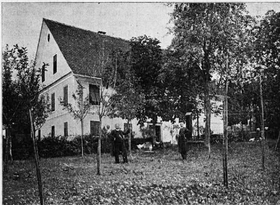
Župnišče na Brezovici.