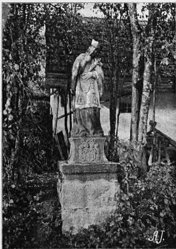
Znamenje sv. Janeza Nepomuka na Brezovici.