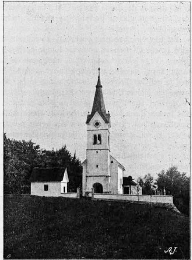
Podružnica sv. Lavrencija v Dragomeru.

spodnji zid sedanje cerkve je ostal še od prejšnje. Podrli so jo namreč le do oken. Prezbitarij pa je bil v stari cerkvi nekoliko manjši kakor je sedanji; strop pa je imela prejšnja cerkev raven in lesen. Že v začetku 19. stoletja je bila ta cerkev zelo slaba; ena cerkvenih sten se je hotela podreti. Zato so l. 1811. izterjali posojenih cerkvenih 43 gld., da so omenjeno steno nanovo sezidali. 1) L. 1837. so napravili pri glavnem vhodu nove kamenite podboje. Naposled pa vsa popravila niso nič pomagala in treba jo je bilo temeljito predelati. Dne 8. julija 1840. l. je bila v stari cerkvi