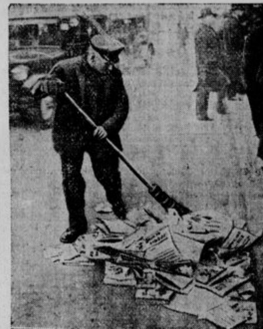
Po volitvah... Cestni pometalec odstranjuje poslednje ostanke, ki spominjajo na ogorčeno volivno borbo.