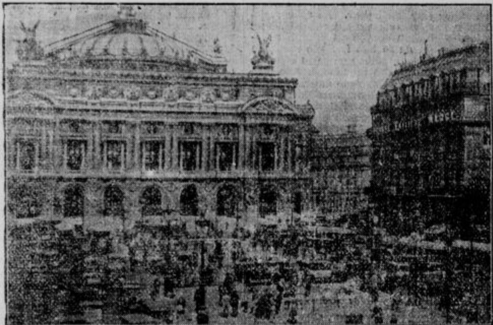
Tudi v Parizu kriza gledališča. Listi poročajo, da stoji znamenita pariška opera pred finančnim pomolom. Ravnateljstvo je vsled stalnih denarnih stisk zaprosilo državno podporo, ki je pa doslej ni dobilo. Brez nje bodo prisiljeni zapreti opero.

Pariške industrijske družbe so že marsikje same zgradile cerkev, ko so videli dobrodelen vpliv na način delavskega življenja. Marsikje se godi, da pri procesiji ali pri pogrebu svira delavska, komunistična godba. Taki in podobni slučajji se dogajajo v teh predmestjih skoro vsak dan.