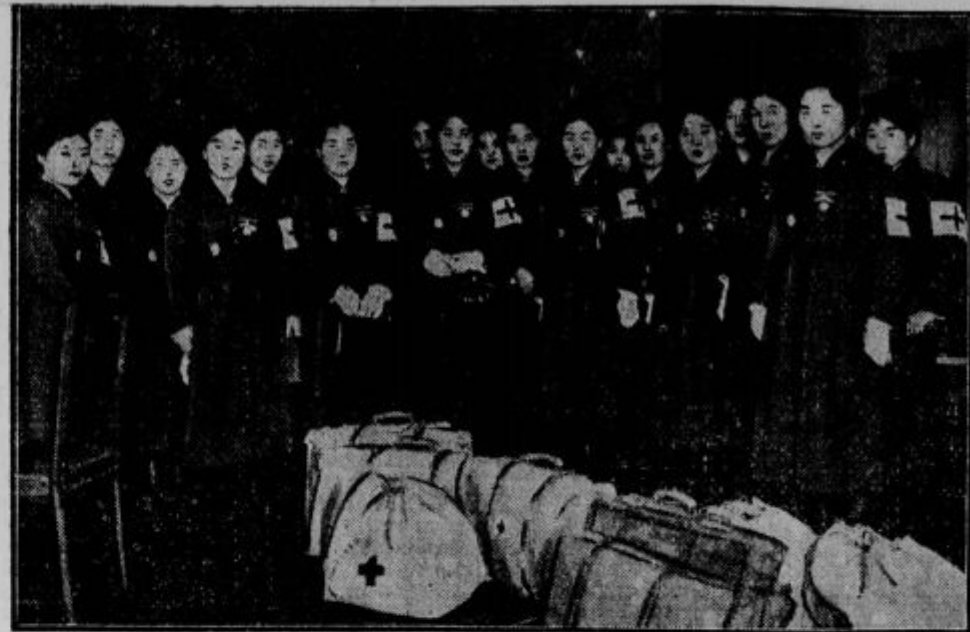
Japonski Rdeči križ. Mlade sestre japonskega Rdečega križa pred odhodom na bojišče.