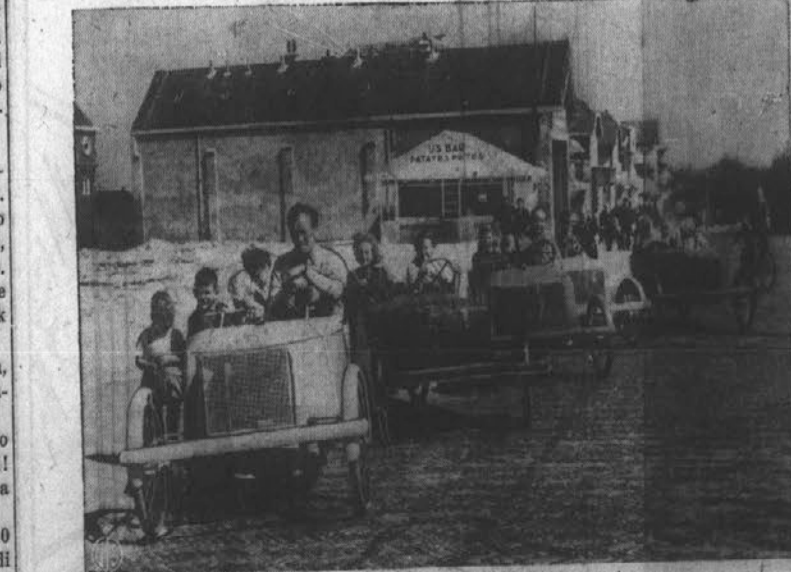
Na Holandskem imajo taksije, katere pogonjajo z nogo, kakor biciklje. Takle tak-sij lahko pelje tri odrasle osebe in s pedali ga lahko pogonjata dva. Komu se ravno ne mudi, da bi zamudil vlak, se lahko postuži takega vozila.

komunistično vzgojena. Mati te-ga ni mogla preboleti. V zmeša-nosti je napravila samomor. Starši nimajo nobene besede več pri vzgoji otrok. Vse je država.