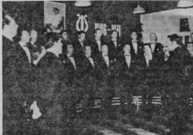
Zbor med nastopom

nivojih samo govorimo in tarnamo, da vokalna glasba ne privlači občinstva in se sprašujemo, kaj bo z našimi narodnimi in umetnimi pesmimi, ko je val popevk tako močan. Odgovor je jase. Ob skrbno izbranem programu in dobrem izvajanju je vsaka zaskrbljenost odveč. Neptvortjena, resnična lepota narodnih in umetnih pesmi je nemisljiva.