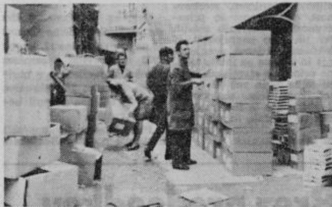
Stiska na Deltinem dvorišču

V tovarni perila in konfekcije v Ptujju je njihovo ozko grlo pomanjkanje proizvodnih kot tudi skladiščnih prostorov. Zato morajo svoje izdelke embalariti na prostem, torej na tovarniškem dvorišču in še to je malo prostora.