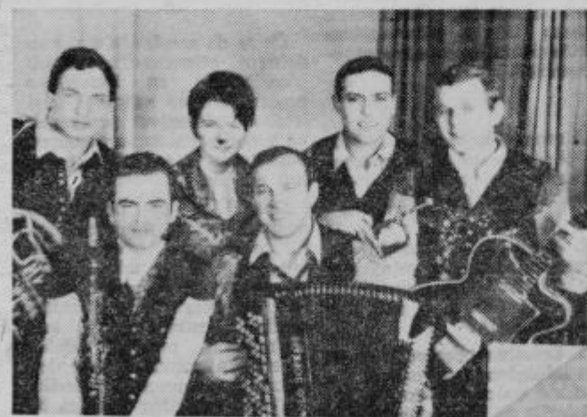
Ansambel Toneta Kmetca y prvotni sestavi

Pred kratkim so se dogovorili o pripravah na jubilejno društvo. Predvideno je, da bo 15. avgusta letos pregled vrzobnoslovenske folklorne v Cirkovcah. Prireditelj bo v dveh delih in sicer bodo v prvem delu prikazali nastope skupin z izvornim sporedom, v tem delu bodo nastopile skupine iz Markovec, Pebrčja, Lancove vasi in iz