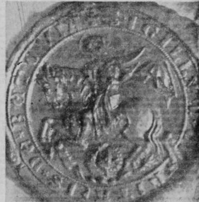
Mestni arhiv Ptuj; Mestni pečat

Ker že ravno pišemo o času in urah, ne bo odveč spomniti na »zgodovinsko« uru na magistratu, ki stoji že zelo dolgo. Skoda je, da se je čas ustavil na tej uri, ki jo opazi vsako malo budneše turistično oko. F. H.