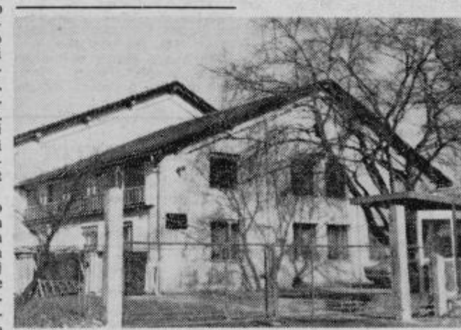
Impolov obrat »MONTAL«

pred leti tako čisti Studenčnici, ki teče vzdolž vasi Pobrezja, Šturmovca in se pri Vidmu izliva v Dravinjo. Žal še do danes ni bilo v tej smeri nič kaj vidnega storjenega, bližajo pa se poletni, to je vroči meseci, ko bo iz Studenčnice vse močnejše smrdelo po odpadkih s farne bekono. Vsekakor pa samopazovanje in ogledovanje strokovnjakov, ki so baše v ta namen prispeli že iz inozemstva, smradu ne bo odpravilo, kajti več kot na dlani je, da je treba kanalizacijo s farne speljati drugam, ne pa v Studenčnico, ki ima prešlab vodotok, da bi lahko vso nesnago sproti odplavljala.